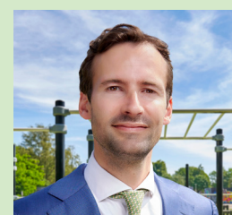
Maes van Lanschot, Eindhoven