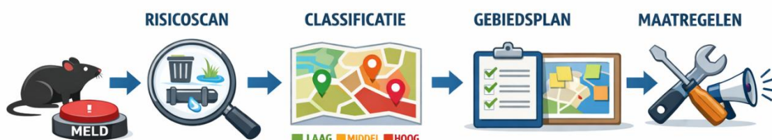
Figuur 2 geen losse bestrijding maar een methode

In meerdere gemeenten wordt deze werkwijze inmiddels toegepast bij gebiedsanalyses en integrale wijkaanpakken. Voorbeelden hiervan zijn casussen waarbij meldingen van bruine ratten aanleiding vormden om breder te kijken naar onder andere afvalstromen, inrichting van de openbare ruimte en gedragingen van bewoners en andere gebiedsgebruikers in een omgeving