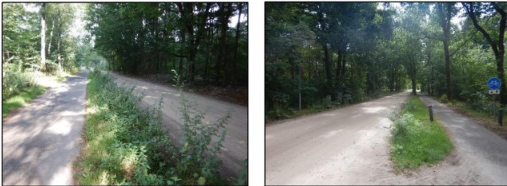
Figuur 6: De structuurrijke vegetatie is geschikt habitat voor de levendbarende hagedis.

Er is geen oppervlaktewater aanwezig op de onderzoekslocatie, waarmee de aanwezigheid van beschermde vissen en voortplantingswater voor beschermde amfibieën kan worden uitgesloten. Het bos aan de Hutdijk is geschikt als landhabitat voor beschermde amfibieën, omdat amfibieën onder het aanwezige dode hout kunnen kruipen. Volgens de IVN is er echter geen padden- of kikkertrek richting de Hutdijk en verder. De padden en kikkers trekken vanuit het Meeuwen richting het zuidwesten. Tijdens het veldbezoek is een inschatting gemaakt op het gebruik van het projectgebied door reptielen. Het projectgebied biedt geschikt leefgebied (structuurrijke vegetatie, zanderige plekken) voor zwaar beschermde soorten (Figuur 6).