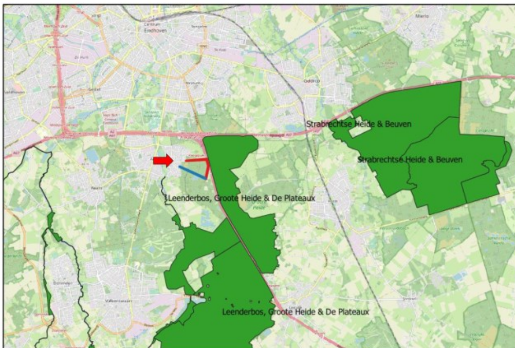
Figuur 3. Ligging van het projectgebied ten opzichte van het Natura 2000-gebied Leenderbos, Grootte Heide & De Plateaux.

Het projectgebied ligt op 40 meter afstand van het dichtstbijzijnde Natura 2000-gebied Leenderbos, Grootte Heide & De Plateaux en op 4600 meter van Strabrechtse Heide & Beuven (Figuur 3).