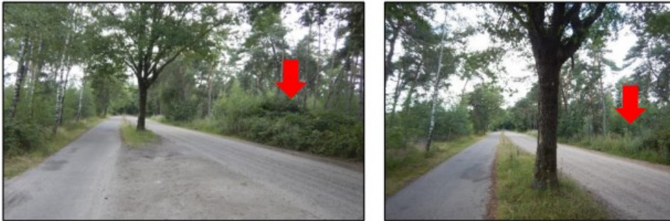
Figuur 5: Geschikte verblijfplaatsen voor kleine marters.

soorten waargenomen. Grondgebonden zoogdieren als algemene muizensoorten, konijn en mol kunnen voorkomen op de locatie.