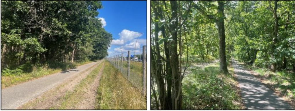
Figuur 2. Impressie van het projectgebied. Met de klok mee beginnend bij linksboven: Hutdijk, verlengde van de Sophiastraat richting de snelweg, projectgedeelte parallel aan snelweg, projectgedeelte richting Hutdijk.