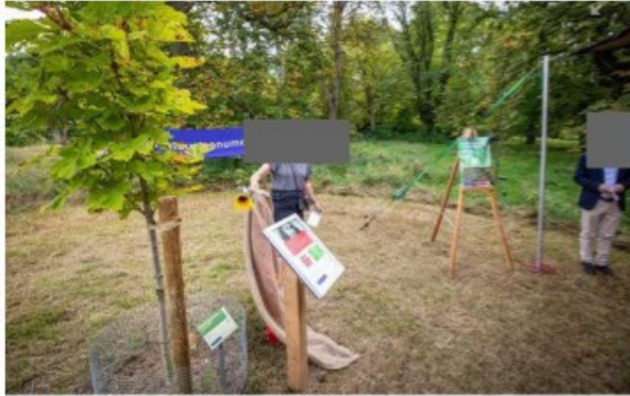
▲ Er is in het Arboretum een zaailing geplant van de kastanjeboom die bij het Anne Frank Huis stond. Daarbij wordt paneel onthuld.