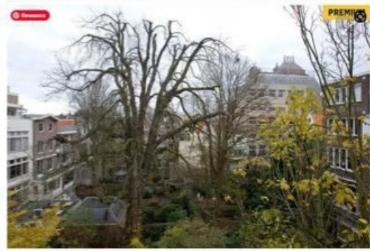
De kastanjeboom die Anne Frank beschreef in haar dagboek. In 2010 ging de boom tegen de vrees tijdens een storm. Klachten van de boom zorgen voor toekomstige.

Hiervoor wordt het plantsoen voor de begraafplaats ter hoogte van de kerk opnieuw worden ingericht. De werkzaamheden zijn inmiddels van start gegaan. Er wordt ruimte gemaakt voor een herdenkingsplek met centraal daarin de Anne Frank Boom.