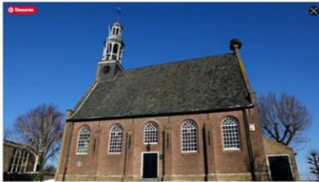
De hervormde kerk in Ottoland.