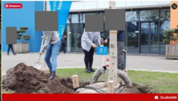
06 april 2022 - 16:29 uur 06 april 2022 - 16:34 uur

LEEK - Onder grote belangstelling is zaterdag een nazaat van de Anne Frankboom onthuld in de Rozentuin op Landgoed Nienoord. Initiatiefneemster [redacted] blikt terug op de trieste afloop van de wegvoerde Joden uit Leek. Daarna las voorzitter van Museum Het Joodse Schooltje [redacted] voor uit het dagboek 'Het Achterhuis' van Anne Frank. Voordat de plaquette werd onthuld door burgemeester [redacted] in directeur van de Anne Frank Stichting [redacted] strooiden de zusjes [redacted] van CBS de Regenboog cacaooppelen rondom de boom.