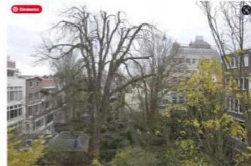
De kastanjeboom op archiefbeeld in 2007.

In de Brabantse gemeente Son en Breugel wordt in verband met Dodenherdenking een nazaat van de 'Anne Frankboom' geplant.