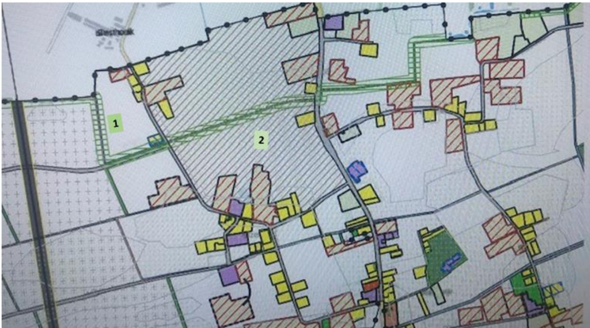
Figuur 1: Omgevingsplan Boekel | Ecologische Verbindingszone Biesthoekse Loop/Meerkensloop

Het doel van deze bijlage is om uw gemeenteraad te informeren over de relatie tussen de integrale gebiedsontwikkeling De Elzen en de opgave van het Waterschap Aa en Maas om een Ecologische Verbindingszone (EVZ) te realiseren rondom De Biesthoekse Loop/Meerkensloop. In onderstaande afbeelding is groen/gearceerd aangegeven dat deze EVZ-opgave verankerd is in het Omgevingsplan Boekel.