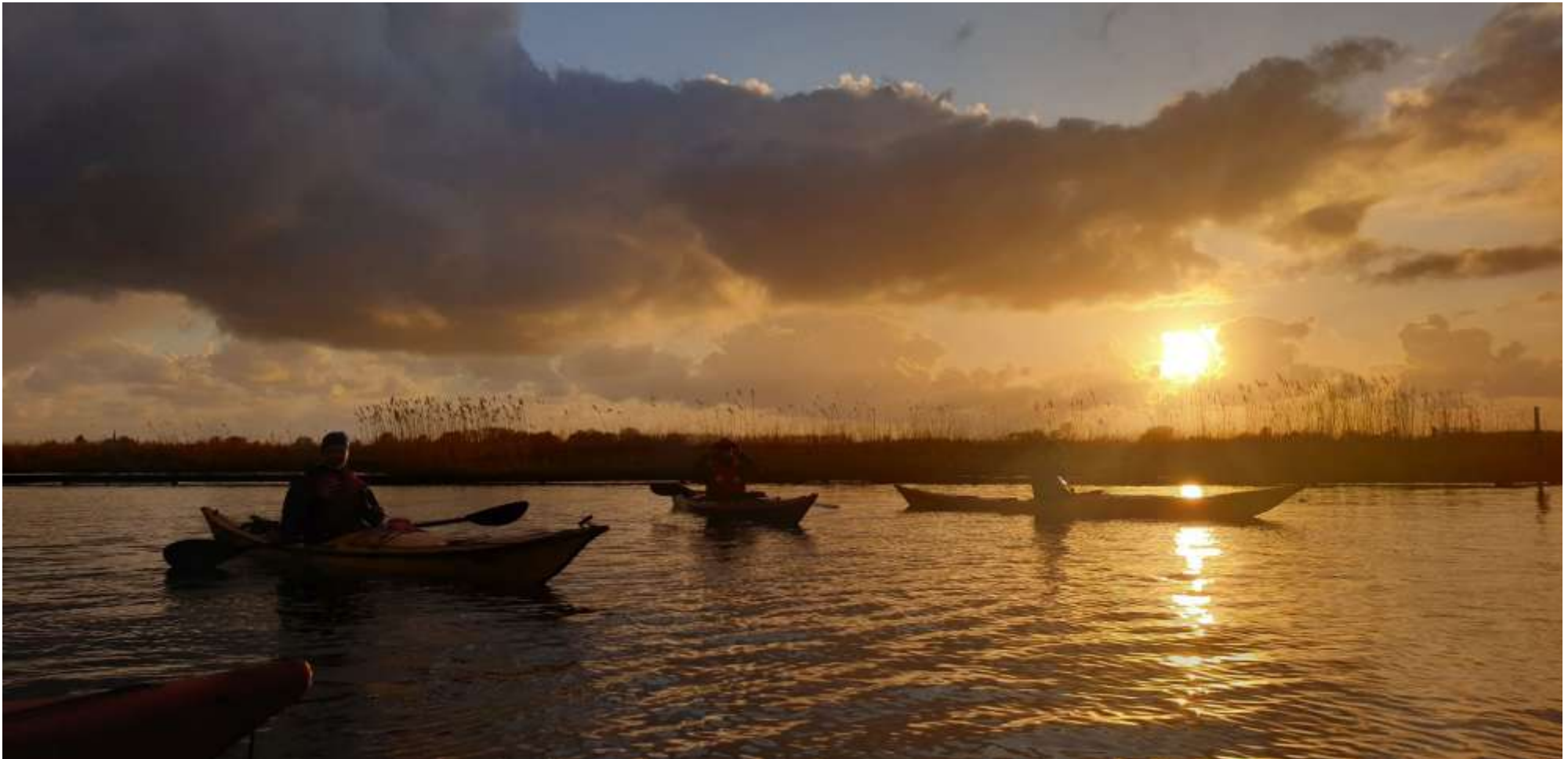
Figuur 5 Kanoën bij zonsondergang op het Uitgeestermeer