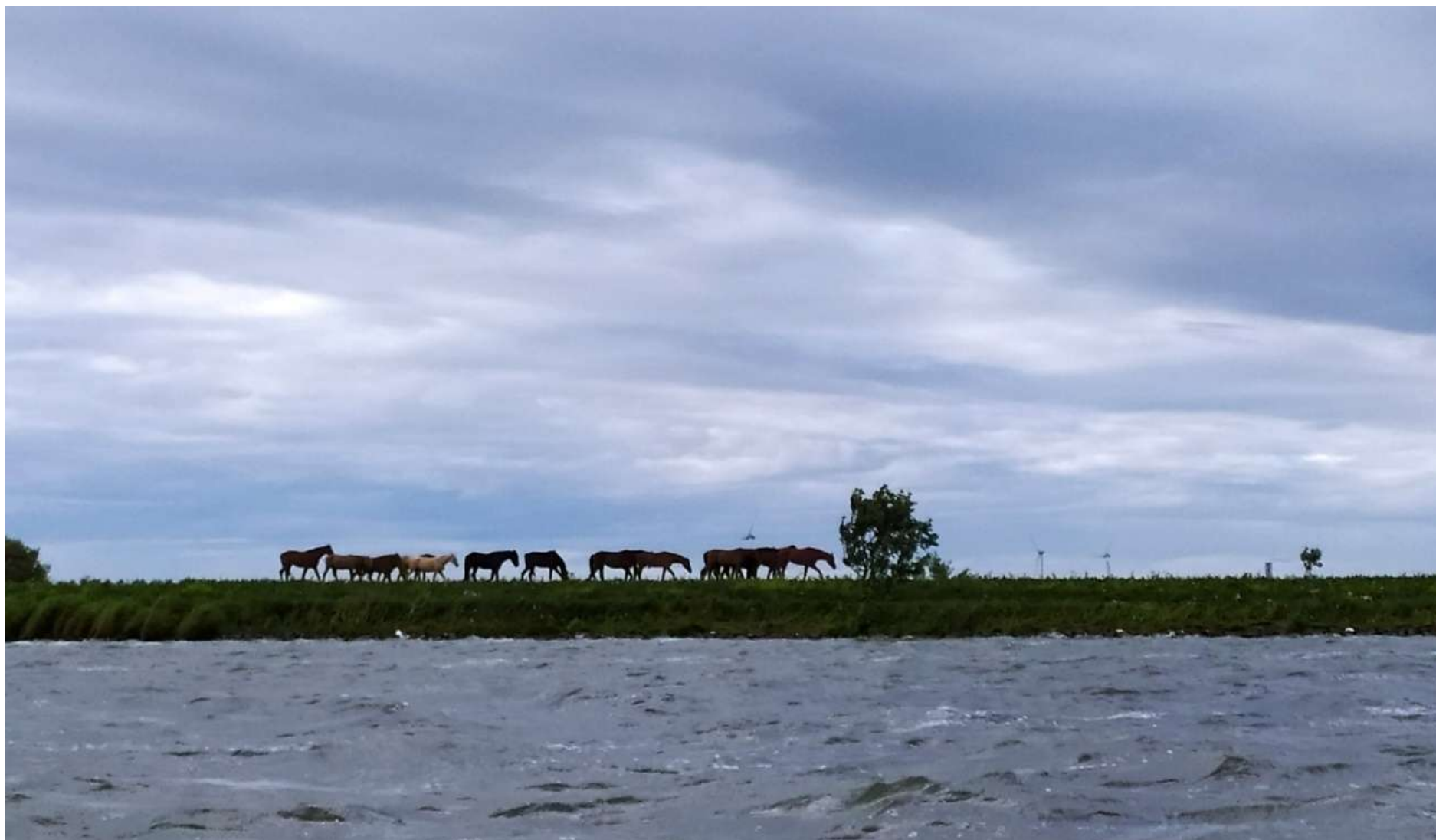
Figuur 2 Paarden op de Sakerleidam