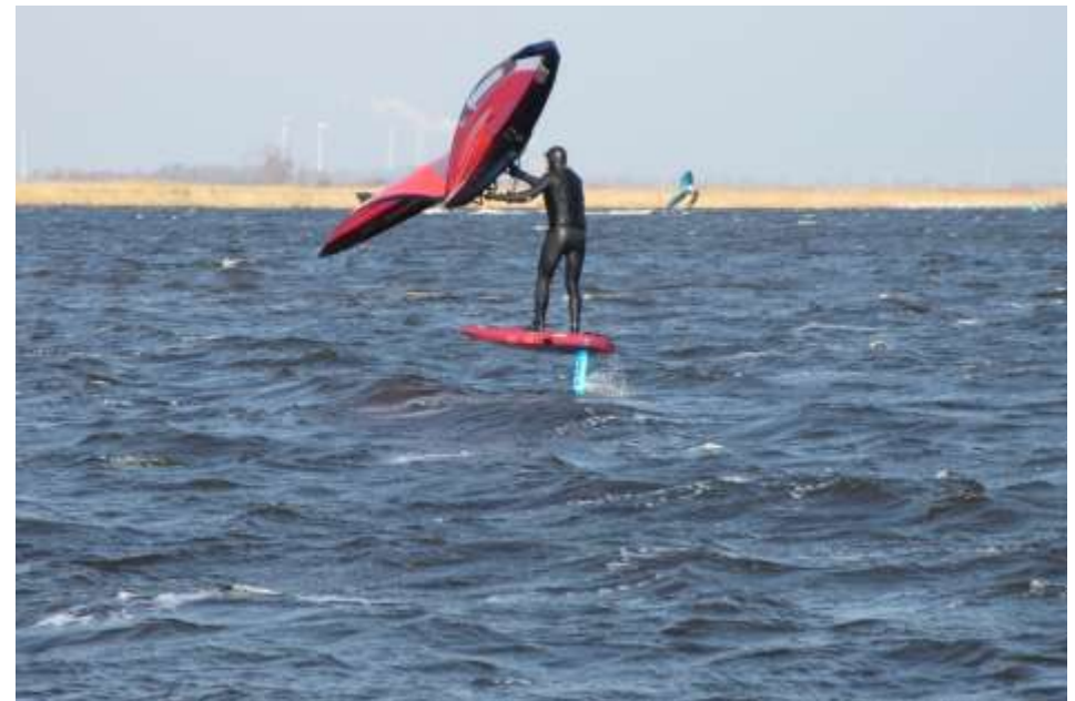
Figuur 3 Wingfoilen op het Uitgeestermeer