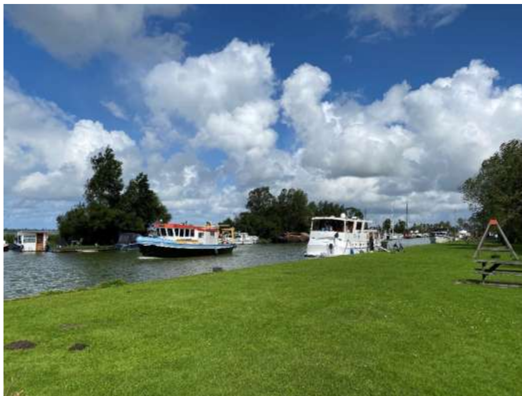
Figuur 1 Speelveld en boten bij De Woudhaven