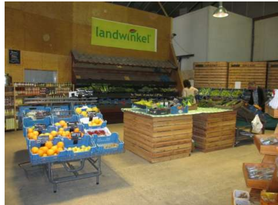
Figuur 4 Landwinkel in de Buitenlanden