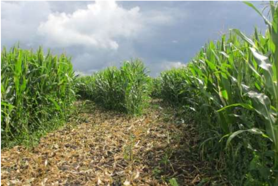
Figuur 6 Naderend onweer boven maisveld in de Buitenlanden