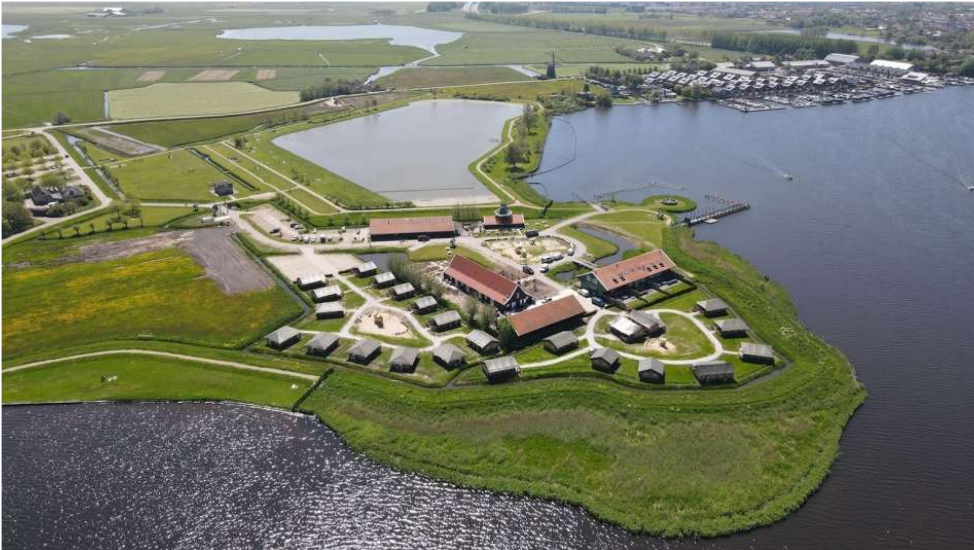
Figuur 7 Luchtfoto van Erfgoedpark De Hoop en jachthaven Uitgeest