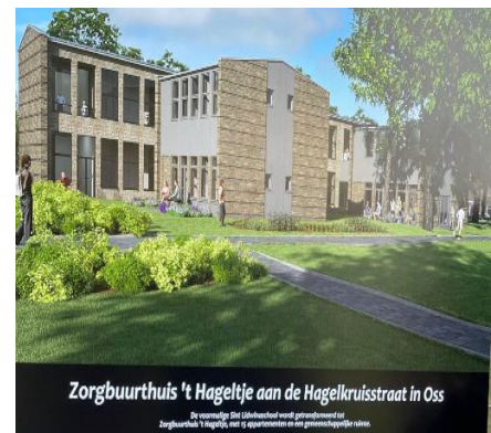
Zorgbuurthuis 't Hageltje aan de Hagelkruisstraat in Oss

De gemeente Oss (Gemeente Oss) heeft het pand Hagelkruisstraat 13, met 5 appartementen en een gemeenschappelijke ruimte.