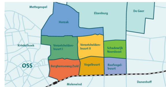
Afbeelding "Schadewijk" (Gemeente Oss, z.d.)

In de Schadewijk scoren de bewoners met name zingeving en meedoen, gemiddeld lager dan in de rest van Oss. Het Zorgbuurthuis kan hier positief aan bijdragen door middel van de mogelijkheden om vrijwilligerswerk te doen of de indicatielose dagbesteding die wordt aangeboden (Gemeente Oss, 2018).