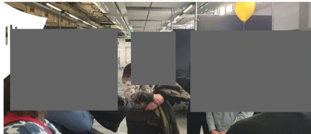
Op een van de demonstratiedagen waar de studenten hun innovaties tonen aan een breed publiek

Zij hebben veel vrijheid om innovatief te zijn maar die vrijheid is niet vrijblijvend. Gedurende het hele proces zien we gezamenlijk hoe de