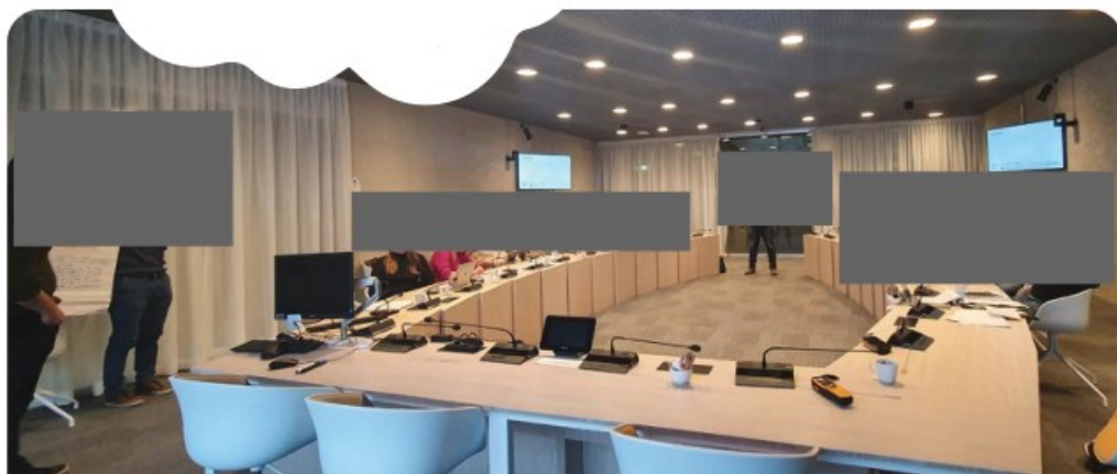
De werksessie op het stadhuis in Eindhoven