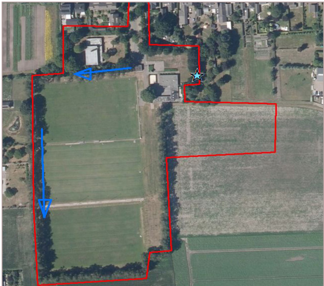
Figuur 3 Waarneming van de steenmarter en éénmaal de das bij een jigglers (lichtblauw). In het westen de houtsingels die werden gebruikt als migratieroute door de steenmarter (donkerblauw).

De steenmarter is enkele keren vastgelegd op camera nabij de noordoostelijke rand van het plangebied (zie figuur 3). De steenmarter werd gelokt door het aas uit de jigglers. In juli werden even na zonsopkomst een tweetal steenmarters gezien, die de houtsingel in westelijke naar zuidelijke richting volgden in vrij hoog tempo. Vermoedelijk is in de omgeving buiten het plangebied zelf de fysieke verblijfplaats aanwezig. Het plangebied zelf (beschutte randen) heeft functie als jachtgebied. De westelijk gelegen houtsingels hebben functie als migratieroute. Behoud van deze singels is belangrijk voor de steenmarter. In de omgeving is ruimschoots geschikt jachtgebied aanwezig, zodat effecten op deze functie door de plannen redelijkerwijs zijn uit te sluiten.