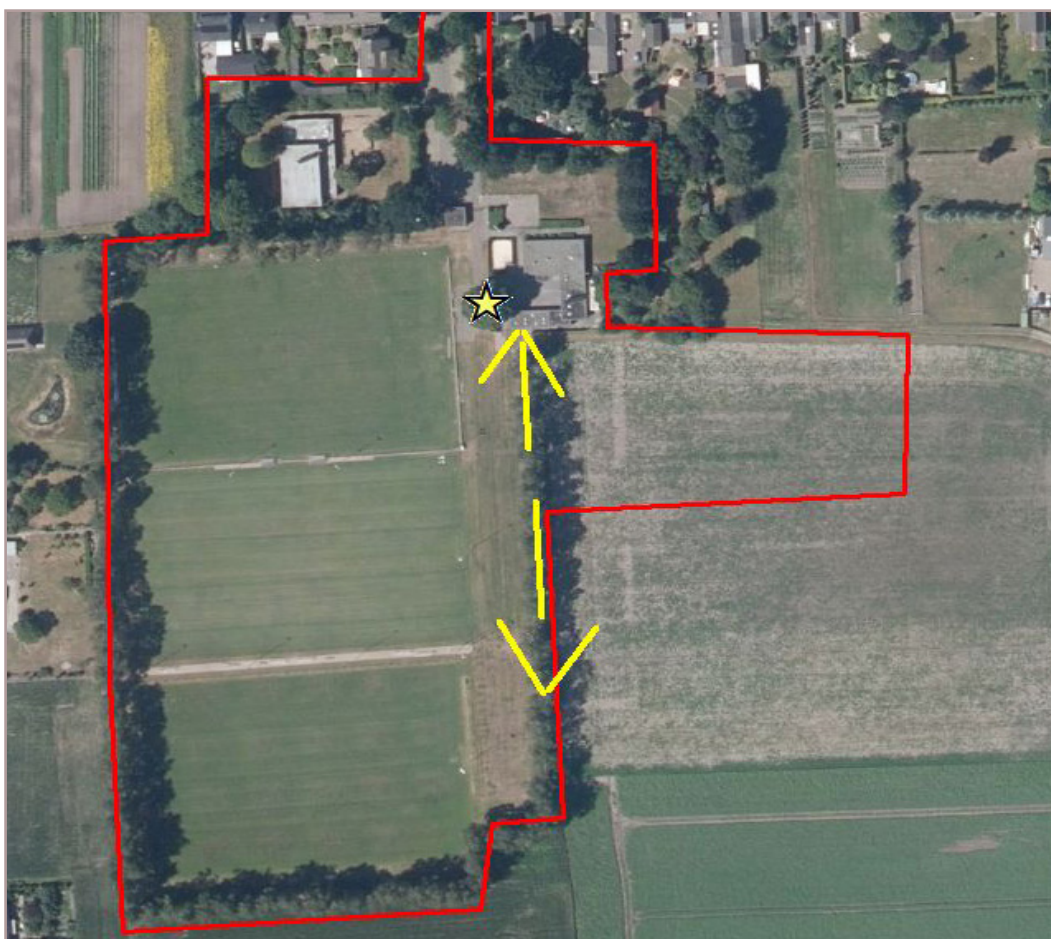
Figuur 2 Weergave vermoedelijke kraamverblijfplaats van de rosse vleermuis (ster in geel). En de houtsingel die functie heeft als vliegroute in beide richtingen.

Reeds bij aanvang van het eerste veldbezoek werden kort vóór zonsondergang rosse vleermuizen gehoord. De dieren werden gehoord ter hoogte van een forse moeraseik. Even na zonsondergang waren de dieren (op enig moment > 10 stuks tegelijkertijd) plotseling aanwezig en jaagden op grotere hoogte boven het plangebied met name boven de sportvelden in het westelijke deel van het plangebied. De rosse vleermuizen keerden later op de avond weer terug. De houtsingel ten zuiden van de eik werd af en toe in beide richtingen op grotere hoogte gevolgd. Mogelijk is een kraamverblijfplaats aanwezig van circa 20 dieren (zie figuur 2). De verblijfplaats was duidelijk aanwezig in de eik, echter bevond deze zich buiten het zicht van de onderzoeker en kon de exacte plek van in- en uitvliegen niet worden vastgesteld.