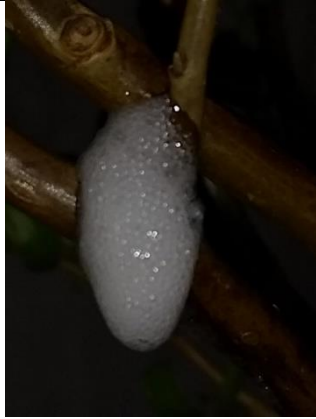
30/04, schuimbeestje , Lia Claus.