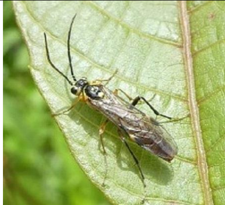
29/04, Tethredopsis spec , Den Hoorn, Willemein Poot.