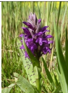
26/04, brede orchis , Schipluiden, Willemein Poot.