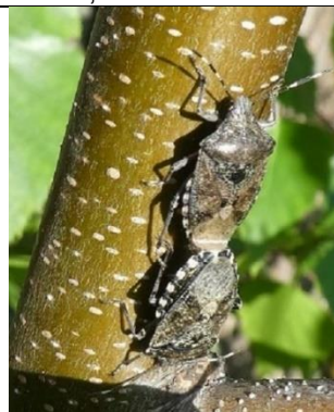
26/04, grauwe wantsen op berk , Den Hoorn, Willemein Poot.