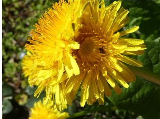
30/04, dubbele bloem paardenbloem , Den Hoorn, Willemein Poot.