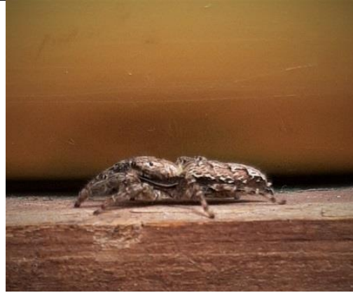
27/04, Marpissa muscosa , Kwintsheul, Kees van der Kraan.