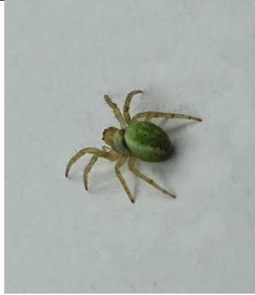
26/04, groen kaardertje , Westland, Cok Grootcholten.