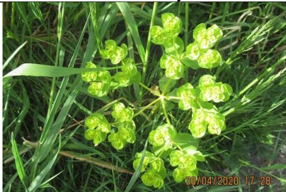
30/04, kroontjeskruid , Delftsestraatweg, Delfgauw, Jos van Koppen.

Delfgauw trof ik bloeiend aan: kroontjeskruid [Euphorbia] , gewone duivekervel , kleefkruid , lievevrouwebedstro en schijnaardbei . Zie foto's.