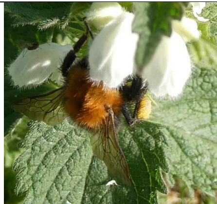
26/04, akkerhommel in witte dovenetel , Den Hoorn, Willemein Poot.