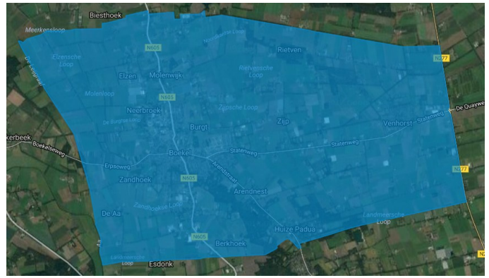
Voorgestelde grenzen bebouwde kom

Op bovenstaande afbeeldingen is de situatie met de huidige grenzen en de voorgestelde grenzen weergegeven. Binnen de gebieden die blauw gearceerd zijn, gelden uitsluitend de gemeentelijke regels. In de gebieden die rood gearceerd zijn, gelden zowel de gemeentelijke regels als de regels van de Wet natuurbescherming. De regels van de Wet natuurbescherming gelden echter alleen voor bepaalde houtopstanden (afhankelijk van boomsoort, aantal stuks in een rij en oppervlakte van een bosgebied).