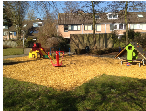
Afbeelding 8.2.2 speelplek in het groen met valdempende ondergrond van dekowood

Deze speelplekken hebben een –gedeeltelijke – ligging in het groen. Gelijk aan de speelplekken op straat hebben deze speelplekken in de huidige situatie nog diverse valondergronden. Bij vervanging worden deze speelplekken - indien mogelijk - voorzien van gazon als valdempende ondergrond. Indien dit om valdempende redenen niet mogelijk is dan wordt gebruik gemaakt van zand of fijne gekleurde houtsnippers in de kleur cypresgeel zoals Dekowood (zie afbeelding 8.2.2). In bijlage 12.2 is weergegeven hoe de opbouw van een valdempende ondergrond met fijne gekleurde houtsnippers moet worden aangelegd. De kleur cypresgeel is gekozen omdat deze kleur een speelplek 'ophaalt'. Het goed in het natuurlijke karakter past en omdat deze kleur het meest is toegepast in de huidige situatie. Hierdoor is dekowood in deze kleur eenvoudiger, duurzamer en goedkoper te beheren en te onderhouden.