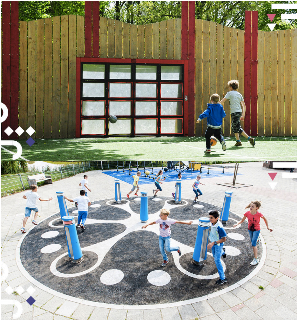
Afbeelding 3.1.2. Electronisch spelen. 15

De ontwikkelingen op dit gebied gaan snel. Het plaatsen van elektronische speeltoestellen ( zie afbeelding 3.1.2) brengt variatie in het aanbod van de gemeente. Het daagt kinderen uit om niet alleen thuis interactief te spelen op een computer maar om naar buiten te gaan en daar met vriendjes en vriendinnetjes te bewegen.