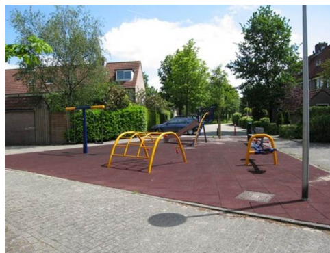
Afbeelding 8.2.1: voorbeeld speelplek op straat 13

Indien gazon niet mogelijk, of wenselijk is wordt bij vervanging gebruik gemaakt van rode rubberen tegels als valdempende ondergrond. De keuze voor een rubber product boven een natuurlijk materiaal zoals houtsnippers komt voort uit het feit dat rubber producten geen overlast op straat veroorzaken. Losse natuurlijke producten komen geregeld buiten de speelplek te liggen. Dit is ongewenst in de stedelijke omgeving. Rubberen tegels hebben de voorkeur boven kunstgras en gietrubber. Het is gemakkelijker te onderhouden en de aanschafwaarde ligt lager. De opbouw van deze ondergrond is in bijlage 12.2 beschreven. De rode kleur is gekozen omdat deze kleur het meeste in de gemeente is toegepast. De keuze voor een kleur maakt het beheer en onderhoud eenvoudiger en goedkoper.