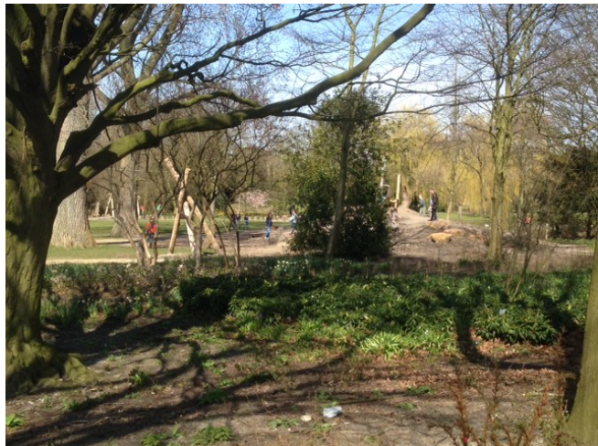
Afbeelding 3.1.1 natuurlijke speelplek i.c.m. robinia houten speeltoestellen

Het voordeel van natuurlijk spelen (afbeelding 3.1) en spelen in de natuur is de positieve invloed ervan op de ontwikkeling van kinderen. Kinderen leren omgaan met de natuur en elkaar, ze worden behulpvaardiger, het stimuleert hun creativiteit en ze krijgen een band met de natuur die op latere leeftijd effect kan hebben op het bewustzijn van een behoefte aan een duurzame wereld 12