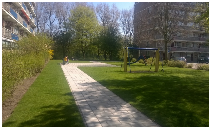
Afbeelding 4.3.2.2 Verduurzamen ondergrond: van boomschors/trottoir naar gazon

Het trapveld aan de Duynsteelaan werd intensief bespeeld. De gemeente moest hier continu onderhoud plegen. Investering in vervanging van het gazon is eenmalig gedaan maar had geen effect omdat het gras geen tijd kreeg om zich te ontwikkelen. Om te zorgen voor een continu bespeelbaar trapveld is op deze plek kunstgras aangebracht.