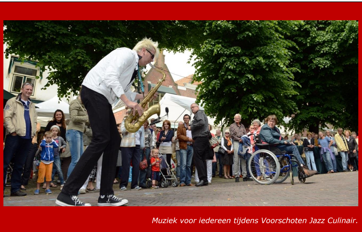
Muziek voor iedereen tijdens Voorschoten Jazz Culinair.

Continueren van de bestaande ondersteuning van evenementen als het 'Weekend van Voorschoten' met onderdelen als de Nationale Muziekdag, de Open Monumentendag en kunstmarkt, de Paardenmarkt en Voorschoten Jazz Culinair. De evenementen zijn vrij toegankelijk en bieden daarmee op een laagdrempelige manier de mogelijkheid om in aanraking te komen met cultuur.