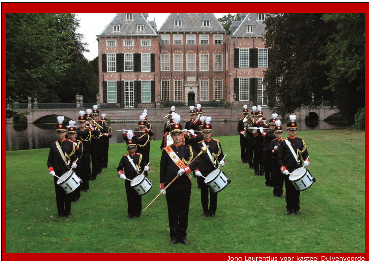
Jong Laurentius voor kasteel Duivenvoorde

Er is geen actueel beleid ten aanzien van het beheer van de kunstcollectie. Dit is wel nodig. Daarom gaan we een opdracht formuleren gericht op de vraag hoe in de toekomst om te gaan met de kunstcollectie en mogelijkheden te onderzoeken om eventueel meer bekendheid te geven aan de gemeentelijke binnenkunst.