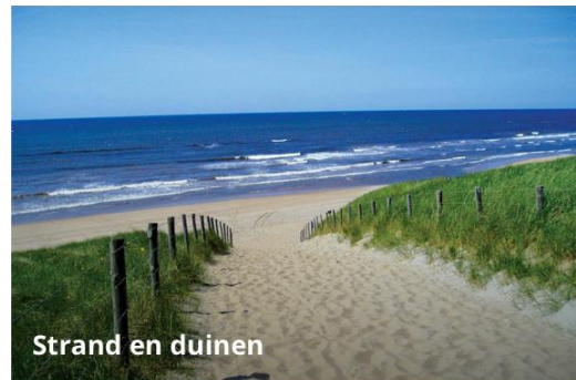
Strand en duinen