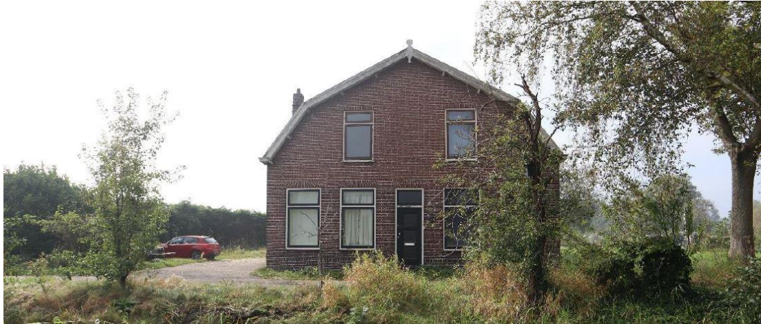
Aanzicht van Het Kerkehout 64

Het bedrijf wordt ontsloten via Het Kerkehout, waarvan het laatste deel een eigen weg betreft. Die eigen weg wordt overigens mede gebruikt door wandelaars en mensen die hun hond uitlaten en die weg is ook ter ontsluiting van het perceel Het Kerkehout 103.