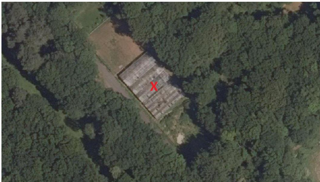
De te slopen kassen

Met de beoogde ontwikkeling worden op het perceel aan de Laan van Pluymestein 11 eerst de bestaande kassen gesloopt. De kassen hebben een oppervlakte van 950 m 2 . Onderstaande afbeelding toont de te slopen bebouwing.