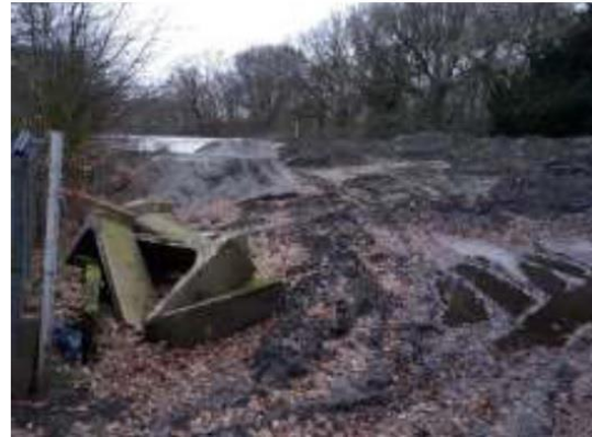
Impressie plangebied Laan van Pluymestein 11

Op het eerste stuk vanaf de Rijksstraatweg na, vormt de Laan van Pluymestein een eigen weg van initiatiefnemer. De weg geeft toegang tot het onderhavige perceel en het verderop gelegen agrarische bedrijf Laan van Pluymestein 36 en enkele woningen. Ten oosten van het perceel bevindt zich de historische buitenplaats Oud Clingendaal. De parkaanleg van deze buitenplaats vormt een Rijksmonument. In het park is nog een kwekerij aanwezig en er zijn enkele monumentale panden aanwezig, waaronder Villa Sijthoff (waarin nu Zorggroep Vandaegh is gehuisvest).