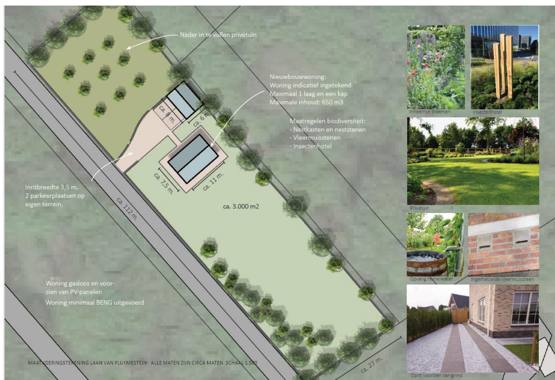
Voorstel erfinrichting Laan van Plumestein 11

Onderstaande afbeelding toont een situatietekening van de beoogde ontwikkeling.