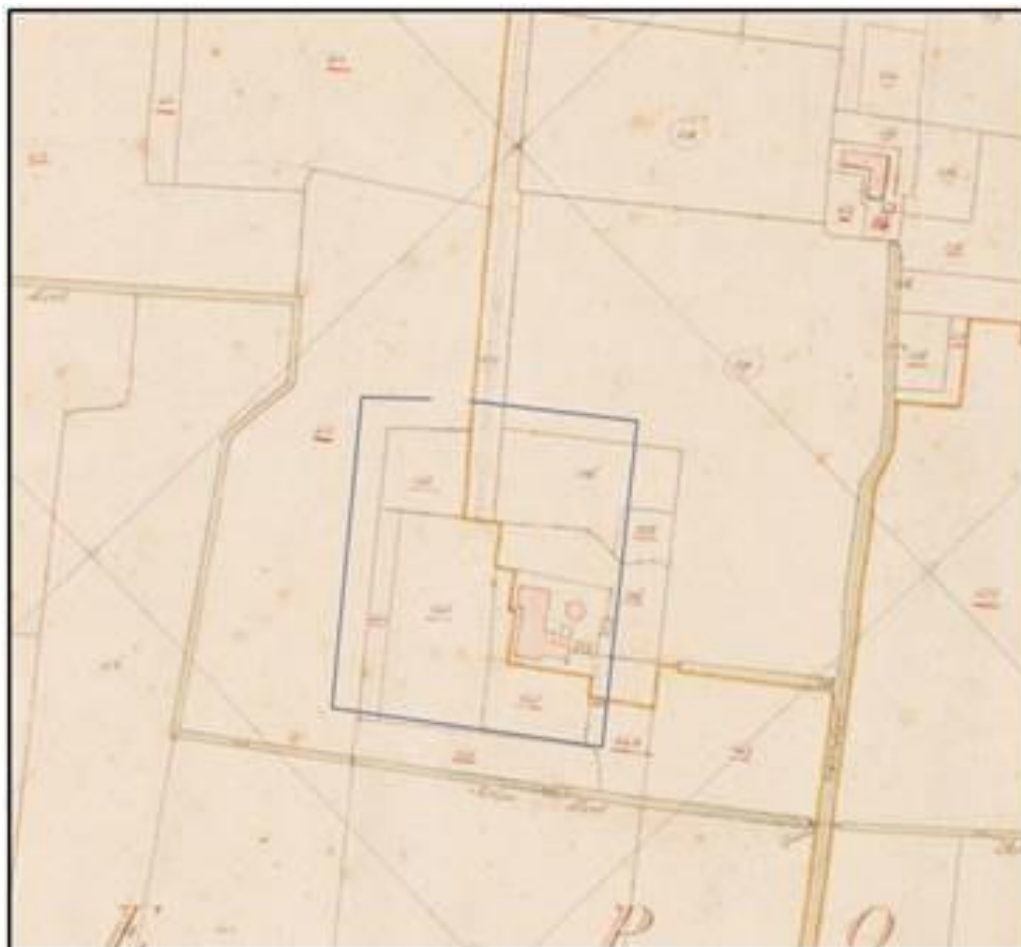
Kadastrale Minuut 1811-1832, de Oude Kerkewoning binnen het oorspronkelijke boerenerv. De uitbreiding van de Nieuwe Kerkewoning vindt plaats binnen dezelfde contouren

Het erf aan Het Kerkehout 64 is een afsplitsing van het erf van de zogenoemde 'Oude Kerkewoning'. De nieuwe boerderij wordt ter onderscheiding de 'Nieuwe Kerkewoning' genoemd. Het erf maakt deel uit van het boerderijlint dat parallel aan de structuur van strandwallen en -vlaktes loopt. De ligging van de boerderijen is op de overgang van het gesloten naar het open landschap. In het gebiedsprofiel 'Duin, Horst en Weide' wordt daarover gezegd: linten blijven linten. Met andere woorden, de boerenerven aan het lint, worden bij herbestemming compact ingericht. De ruimtes tussen de erven worden niet verdicht. Nieuwe ontwikkelingen doen recht aan de korrelgrootte en de typologie van het erf. Transformaties sluiten aan bij de bestaande kavelopbouw: een hoofdgebouw voorop het erf met een of meer bijgebouwen en hoog opgaande beplanting (streekeigen soorten) rondom. Eventuele nieuwbouw past binnen de erftypologie en vormt een moderne interpretatie van de historische boerderijgebouwen (inclusief bijgebouwen). Daarbij is sprake van een eenduidige ontsluiting, in dit geval Het Kerkehout, zelf ook een waardevolle laanbeplanting.