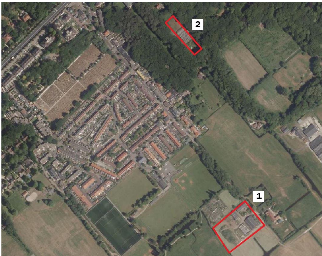
Globale begrenzing plangebied, rood omcirkeld

De onderstaande kaart toont de globale begrenzing van het plangebied: met 1 is het deelgebied Het Kerkehout 64 aangegeven en met 2 het deelgebied Laan van Pluymestein 11.