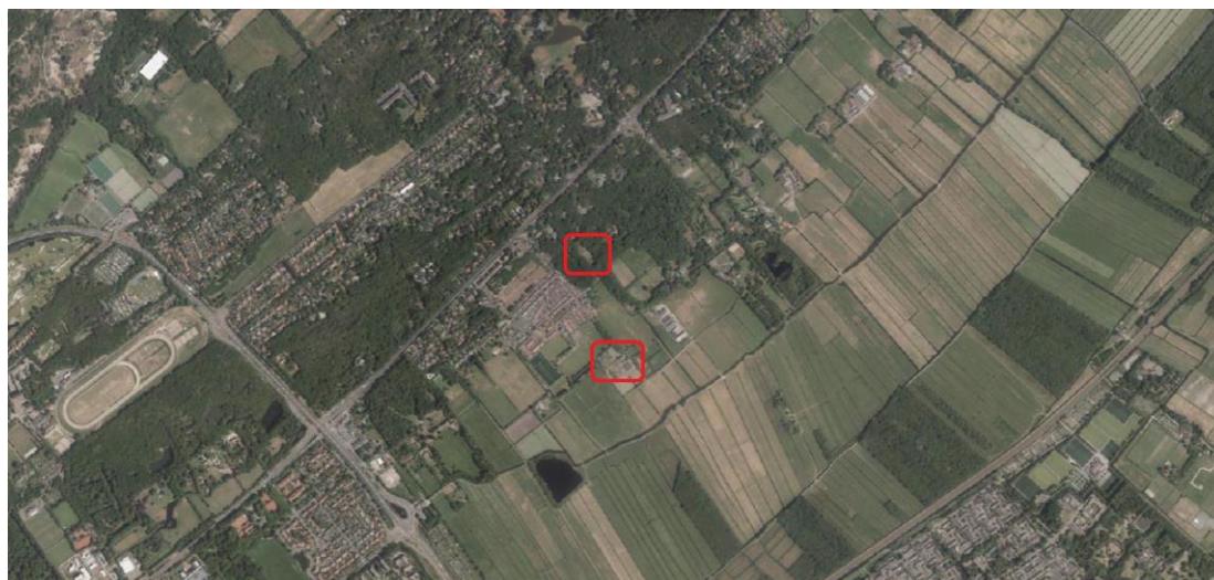
Globale ligging plangebied, rood omcirkeld

De twee deelgebieden bevinden zich nabij de wijk Kerkehout en landgoed Oud Clingendael in de gemeente Wassenaar. Het perceel van Het Kerkehout 64 is bekend onder de kadastrale gemeente Wassenaar, sectie D en perceelnummers 3092 en 2563. Het perceel gelegen aan de Laan van Pluymestein 11 is bekend onder de kadastrale gemeente Wassenaar, sectie D en perceelnummer 2104. Onderstaande afbeelding geeft de globale ligging van het plangebied weer.