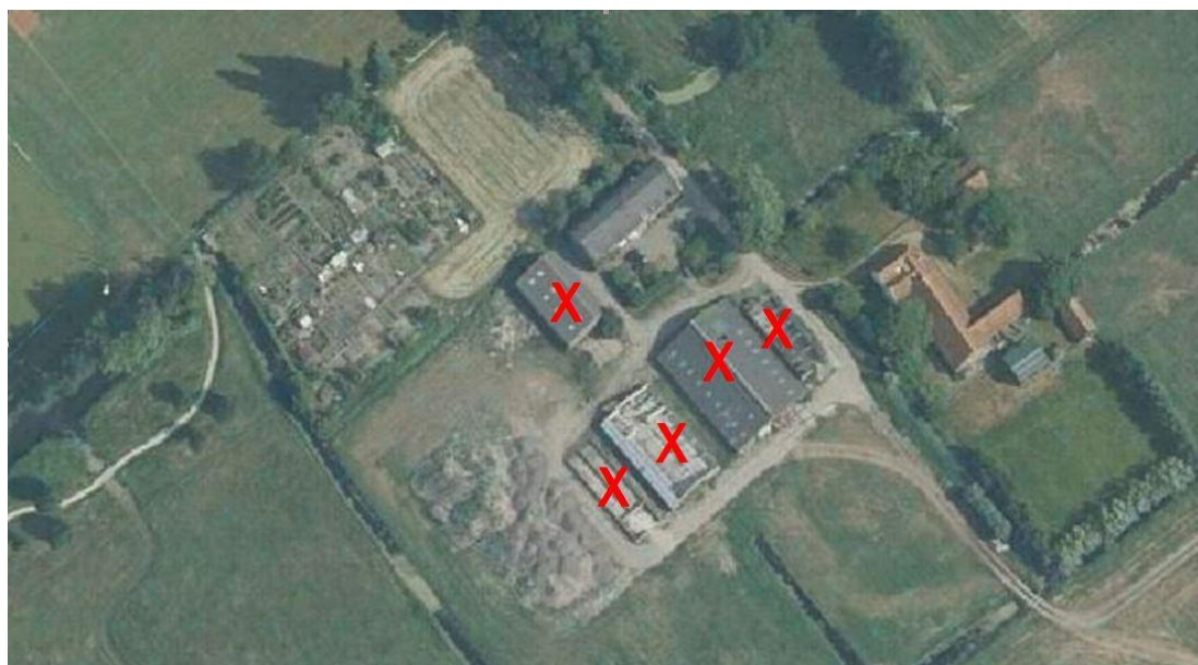
De te slopen agrarische bedrijfsbebouwing

Het voorstel is om 1.650 m 2 aan agrarische bedrijfsbebouwing op het perceel aan Het Kerkehout te slopen. Onderstaande afbeelding toont de te slopen stallen en schuren.