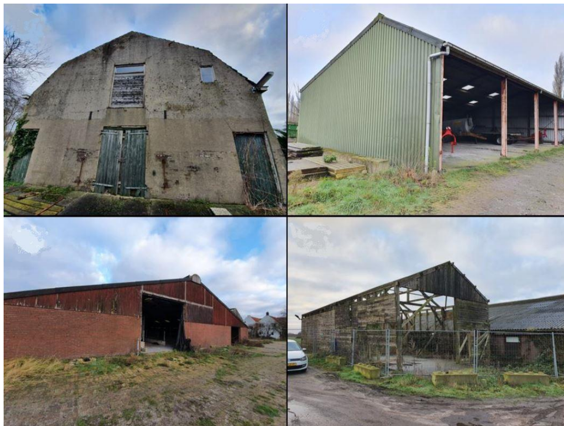
Bestaande situatie op Het Kerkehout 64

Op het perceel aan Het Kerkehout staat een (voormalige) melkveebedrijf. Het bedrijf bestaat uit een hoofdgebouw met een bedrijfswoning en uit een viertal agrarische opstallen. Het hoofdgebouw met de bedrijfswoning is in 1917 na een brand hersteld conform de tekeningen uit 1909. Het vormt een afsplitsing van de Kerkewoning op nummer 103 en wordt ook wel de 'Nieuwe Kerkewoning' genoemd. Daarachter is een vrijstaande werktuigenloods aanwezig. In de jaren 70 een melkveestal gerealiseerd. Tegen deze stal is een schuur aanwezig die zich thans in een vervallen toestand zonder dak bevindt. Aan de andere zijde van de melkveestal is een stal uit 1992 aanwezig die inmiddels ook in vervallen toestand en zonder dak is. Aansluitend was nog een kweekkas aanwezig, maar deze is inmiddels goeddeels ontmanteld.