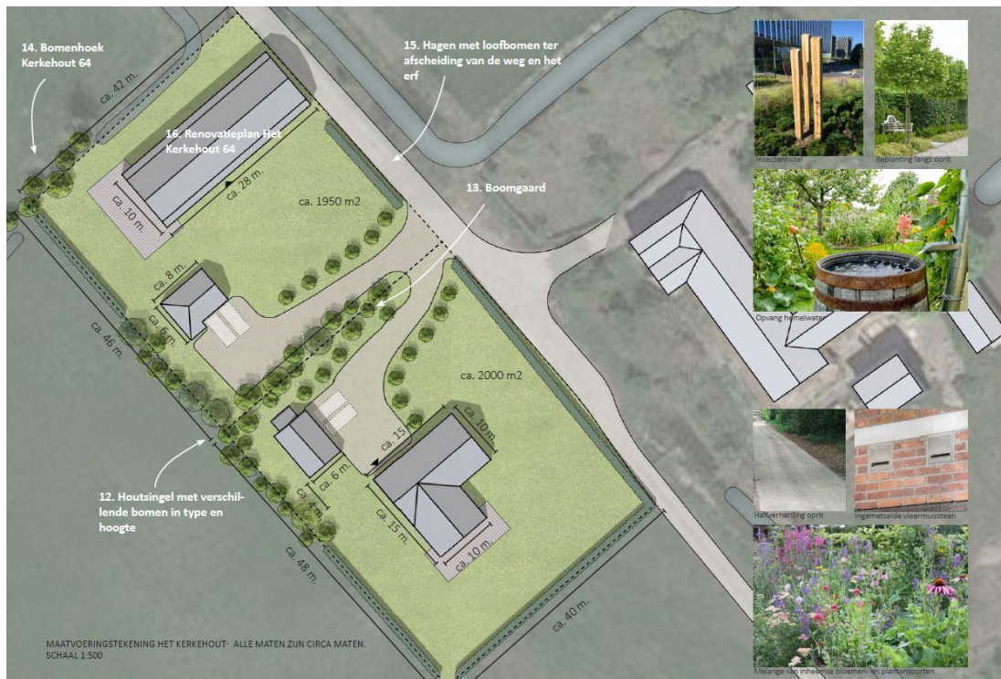
Voorstel erfinrichting Het Kerkehout 64 (bron: Hegeman Bouwteam, 21 juni 2022)

Onderstaande afbeelding toont een situatietekening van de beoogde ontwikkeling.