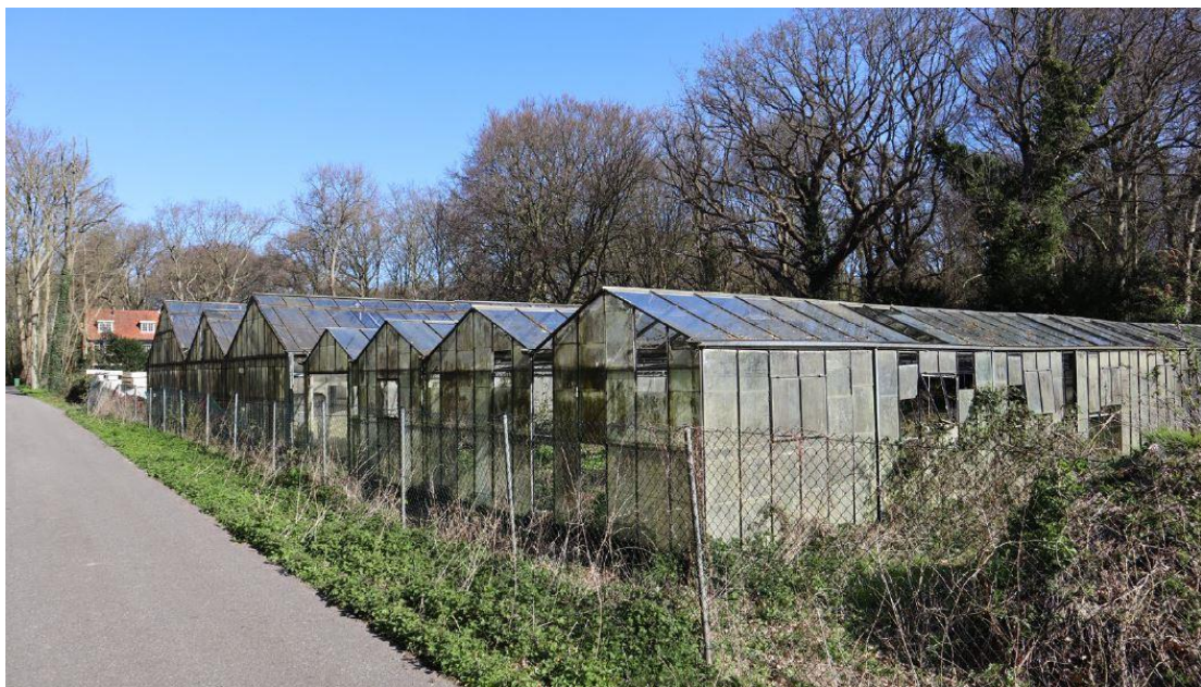
Bestaande situatie Laan van Pluymestein 11

Onderstaande afbeeldingen geven een impressie van het plangebied.