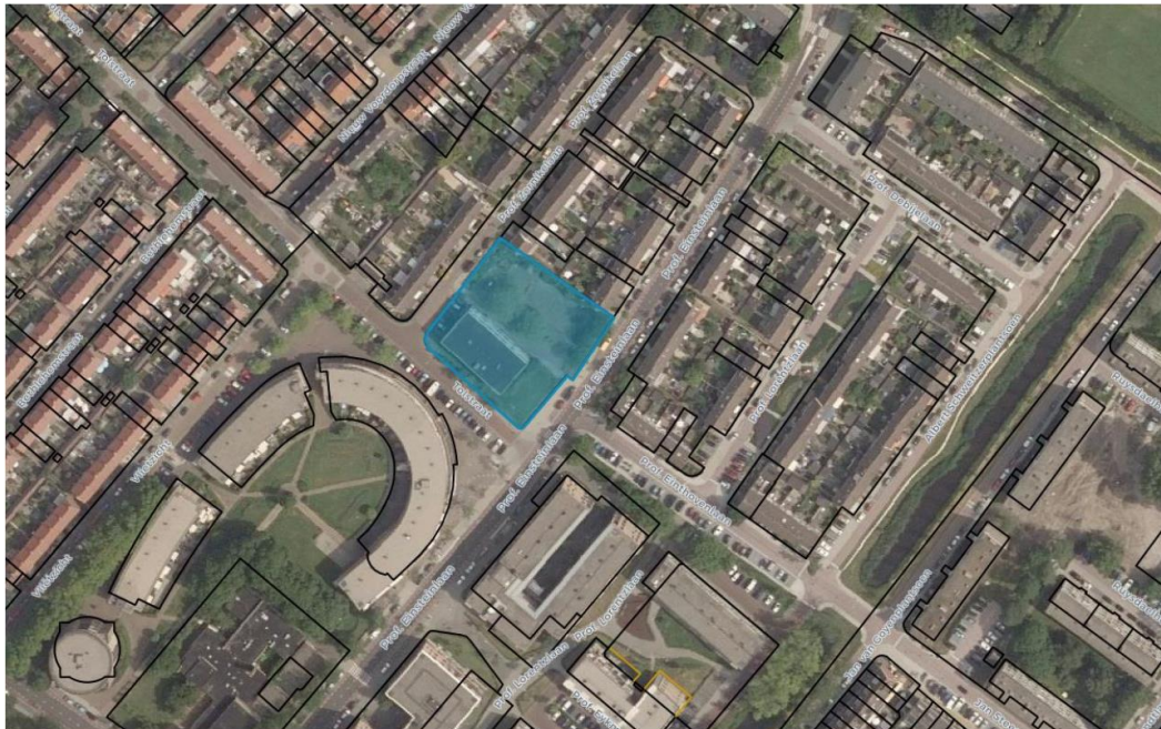
Afbeelding 1a: Ligging van het plangebied