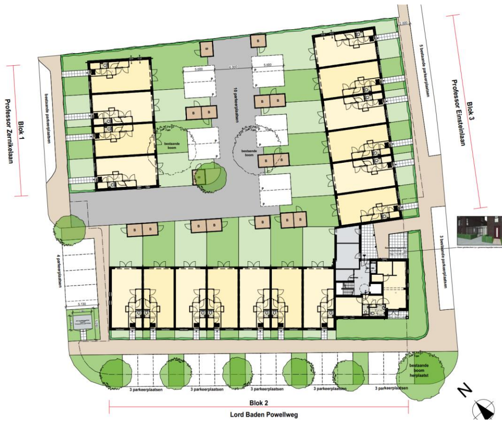
Afbeelding 2: Situatietekening Plan