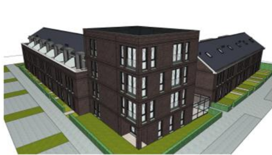
Afbeelding 3: Impressie vanaf de Professor Einsteinlaan