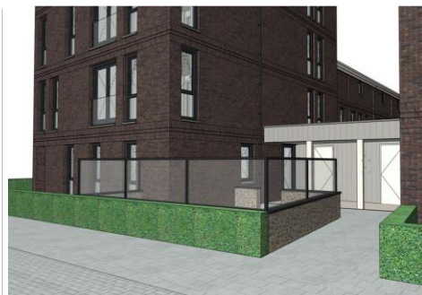
Afbeelding 4: Buitenruimte met geluidscherm