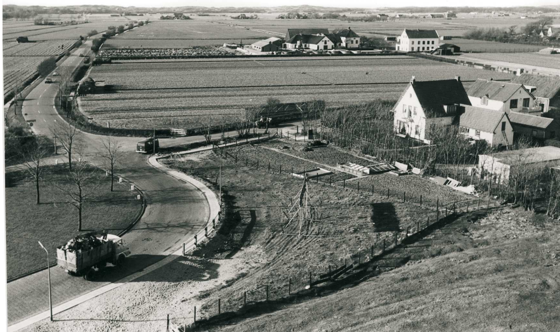
1974, GAW4333, de bollenschuur is het witte gebouw rechts bovenaan de foto.