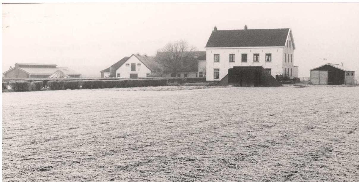
1974, GAW 1479