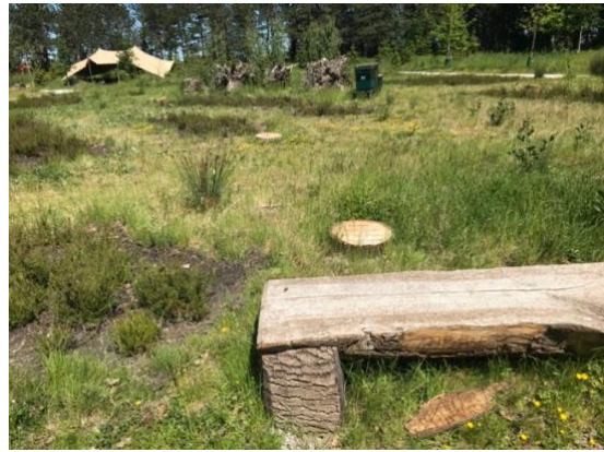
Natuurlijk begraven op Hofwijk Rotterdam

De beoogde Natuurbegrafplaats Rosenburgh mag met recht een echte natuurbegrafplaats genoemd worden omdat aan de meeste criteria voldaan wordt. De oppervlakte is voldoende groot (meer dan 1 ha), de nadruk ligt op natuurontwikkeling en het versterken van biodiversiteit, de uitgiftetermijn is lang (100 jaar) en er komen strikte voorwaarden voor duurzaam begraven. De medewerkers worden bijgeschoold in ecologisch beheer en laten zich adviseren door deskundigen. Bij de promotie van Gedenkpark Rosenburgh wordt Natuurbegrafplaats Rosenburgh een apart handelsmerk binnen het totaalconcept van Gedenkpark Rosenburgh, net als de reguliere begrafplaats, de dierenbegrafplaats en de aula.