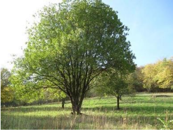
Salix caprea, boswilg