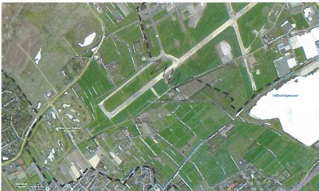
Indicatieve toekomstige begrenzing Groene Buffer