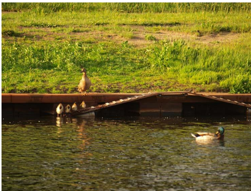
Als oplossing voor de foto op de voorkant van deze nota