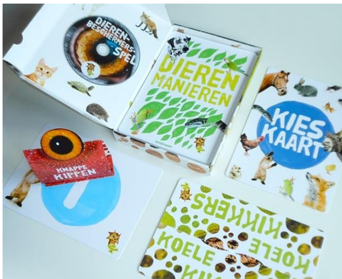
Voorbeeld van lesmateriaal dierenwelzijn voor het basisonderwijs