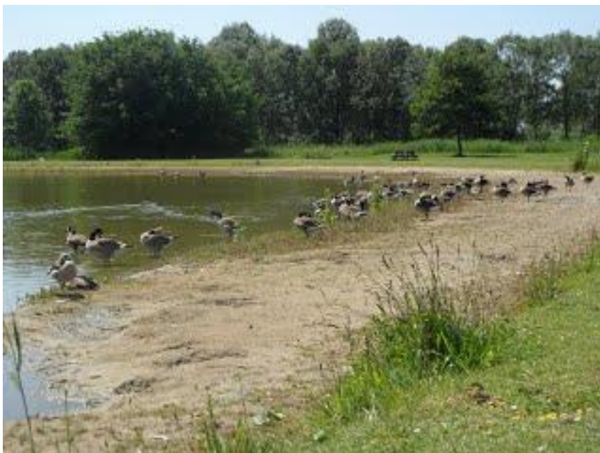
Ganzen(overlast) in het Wilhelminapark

Tijdens de inventarisatie zijn door dierenbeschermingsorganisaties en betrokken inwoners tal van concrete suggesties gedaan om in het wild levende dieren beter te beschermen, hun leefomgeving en de mogelijkheden voor voortplanting te verbeteren en de bio diversiteit in Rijswijk te bevorderen.