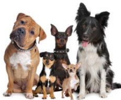
Hoe ziet het nieuwe hondenbeleid er straks uit?

Onder gezelschapsdieren verstaan we onder andere honden, katten, cavia's, konijnen, vogels, reptielen, amfibieën en vissen maar ook hobbymatig gehouden landbouwhuisdieren zoals schapen, geiten, paarden en kippen. Regels met betrekking tot gezelschapsdieren zijn vastgelegd in de Wet dieren en nader uitgewerkt in het Besluit houders van dieren en het Besluit gezelschapsdieren. Uit de inventarisatie blijkt dat we al heel veel doen voor onze gezelschapsdieren mede door inzet van hun eigenaars en onze maatschappelijke partners dierenwelzijn. Er zijn echter ook een aantal hiaten geconstateerd (zoals bijvoorbeeld het ontbreken van een overeenkomst met kinderboerderij de drassige driehoek), en moet er in een aantal gevallen bestaand beleid en/of een overeenkomst geactualiseerd worden (zoals bijvoorbeeld het hondenbeleid en de overeenkomst met kinderboerderij het Akkertje).