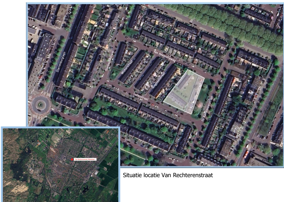
Situatie locatie Van Rechterenstraat

De locatie is gelegen aan de Van Rechterenstraat, tussen de Luzacstraat, De Kempenaerstraatstraat en Van Heemstraweg in de buurt Zijlwatering en Haven.