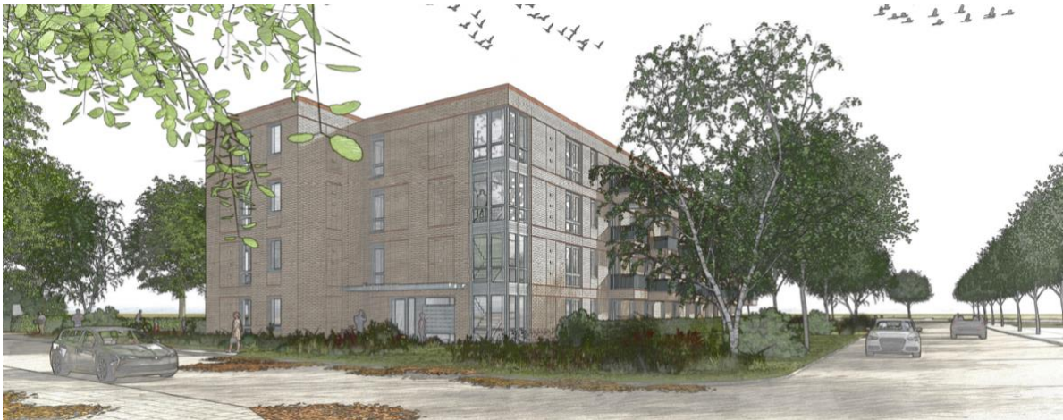
Impressie nieuwbouw entreezijde Luzacstraat

Het ontwerp is zorgvuldig afgestemd met de gemeente en past binnen de stedenbouwkundige visie. Het stedenbouwkundig plan is hierdoor aangepast door de gebouvvolumes ten opzichte van elkaar te verschuiven en een duidelijke entreepartij te creëren. Om dit te realiseren is het aantal woningen teruggebracht naar 48 appartementen