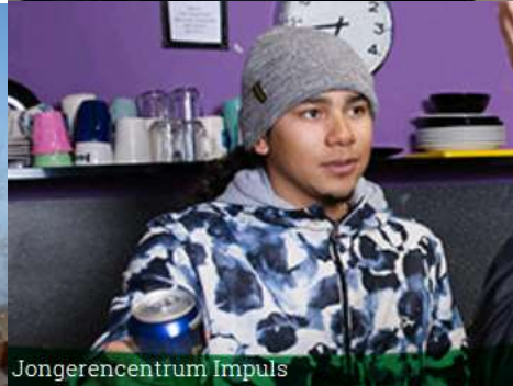
Jongeren centrum Impuls