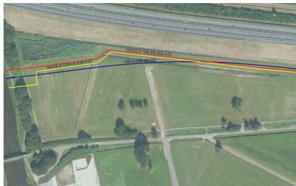
Figuur 2 Gewenste tracé