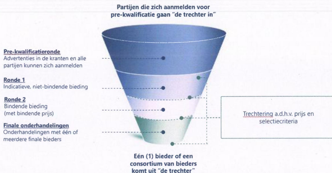
Figuur 1. Bieding en selectieproces

Voordat de transactie definitief kan worden afgerond, is naast het definitieve besluit van de aandeelhouders een aantal processtappen relevant. Zo zal, afhankelijk van het profiel en de activiteiten van de koper instemming van (een) nationale mededingingsautoriteit(en) van de landen waarin Eneco actief is dan wel de Europese mededingingsautoriteit (Europese Commissie van Mededinging) vereist zijn. Tot slot, hebben de betrokken partijen bij de verkoop een meldingsplicht aan de minister van Economische Zaken en Klimaat o.b.v. de Elektriciteitswet. Op 28 januari 2019 heeft minister Wiebes zich hierover uitgelaten in een brief aan de voorzitter van de Tweede Kamer 3 .