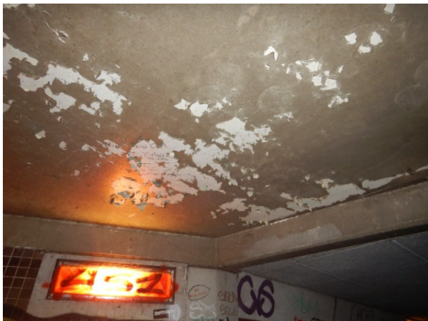
Conservering dak: bij variant 2 wordt dit wel vernieuwd, bij variant 3 niet