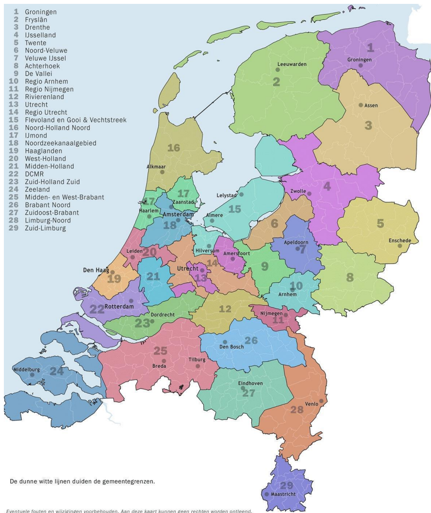
Figuur 2 Overzicht omgevingsdiensten.