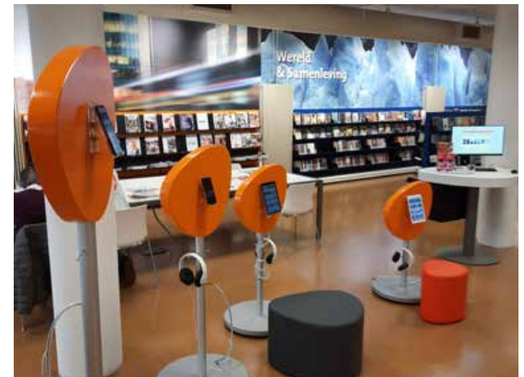
Opstelling app tour Online bibliotheek