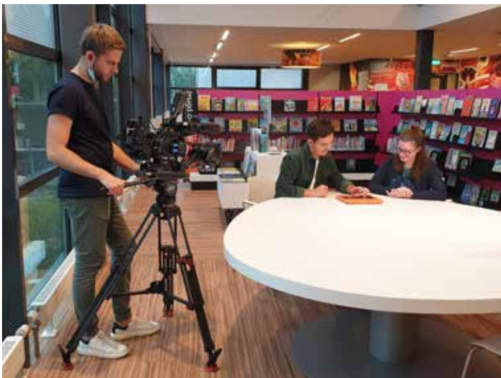
RTL 4 filmt in bibliotheek Leidschendam voor programma 'Onderweg naar de Regio'