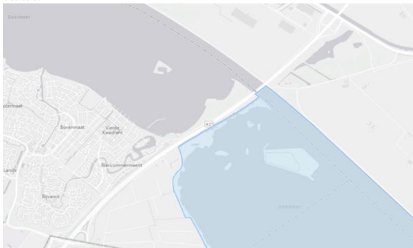
Afbeelding 2.2: het Eemmeer (blauw gearceerd) heeft een Natura 2000 status.

natuurgebieden Natura 2000 (zie afbeelding 2.2 hieronder). Activiteiten aan de westkant van de landstrook kunnen mogelijk negatieve effecten hebben op het Natura 2000-gebied.