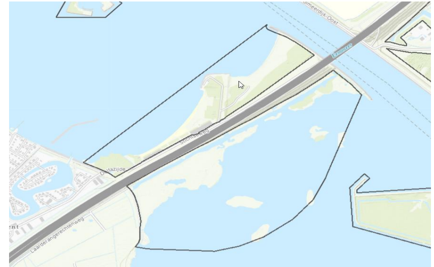
Afbeelding 2.1: begrenzing eigendom Staatsbosbeheer. De gebieden binnen de zwarte omranding vallen binnen het eigendom van Staatsbosbeheer.

Staatsbosbeheer heeft een huurovereenkomst gesloten met de gemeente Blaricum waarvan de looptijd tot en met 2028 is. Hierin staan bepalingen omtrent beheer, onderhoud, financiën, maar voor een belangrijk deel ook over het gebruik van het gebied. Staatsbosbeheer heeft toestemming gegeven voor het recreatiestrand waarbij de gemeente bewust dient te zijn van en handelen naar de natuurwaarde van het gebied. Volgens de overeenkomst is de gemeente verplicht om als goed huisvader te zorgen voor het behoud en onderhoud van het gebied. Hierbij dient behoud en uitbreiding van de aanwezige natuurwaarden nadrukkelijk betrokken te worden.