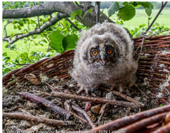
Figuur 1 Juveniel van de ransuil. Afbeelding TAUW-rapport Activiteitenplan.

Merkwaardig genoeg vermeldt het College dit wel in de Toelichting. Daar staat de volgende passage te lezen, waarbij we in het bijzonder wijzen op de laatste zin.