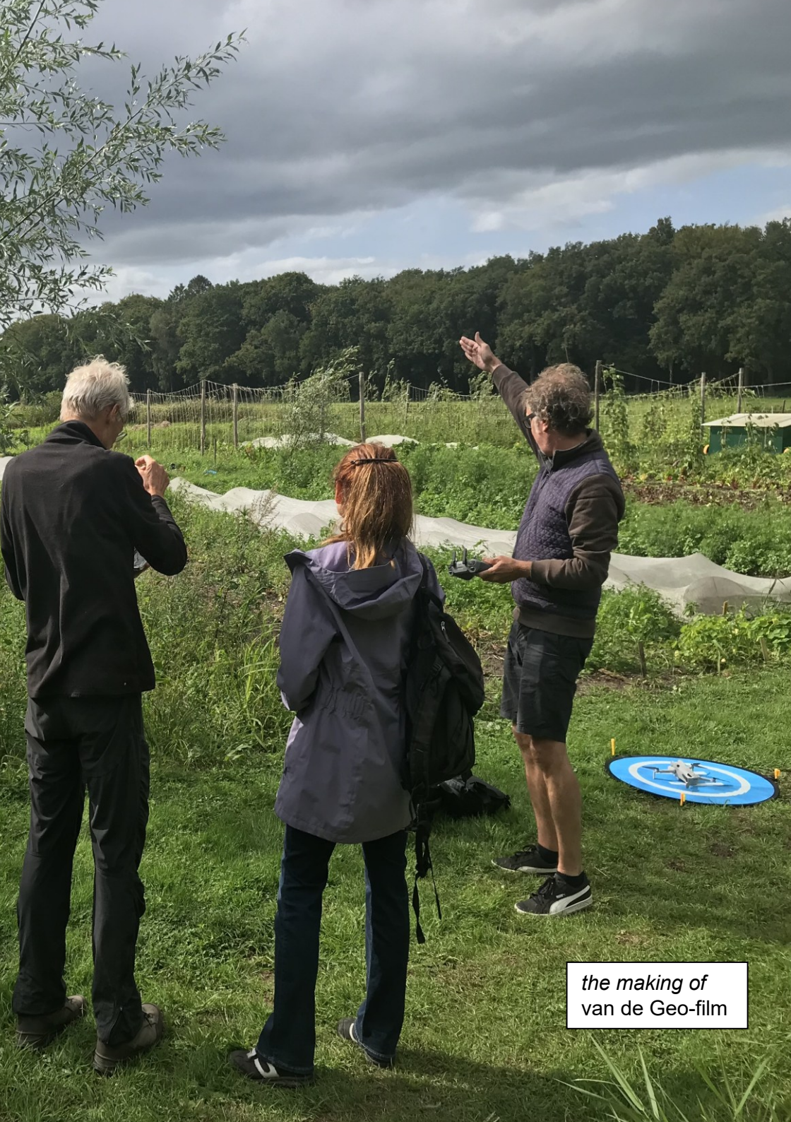
the making of van de Geo-film