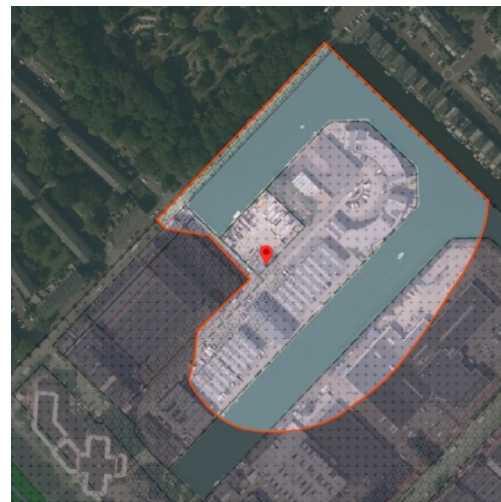
Gebiedsaanduiding 'geluidzone – industrie'