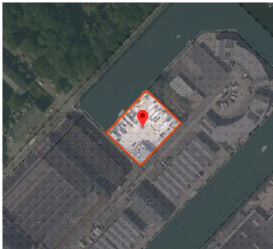
Aanduiding 'specifieke vorm van bedrijventerrein – betonmortelcentrale'