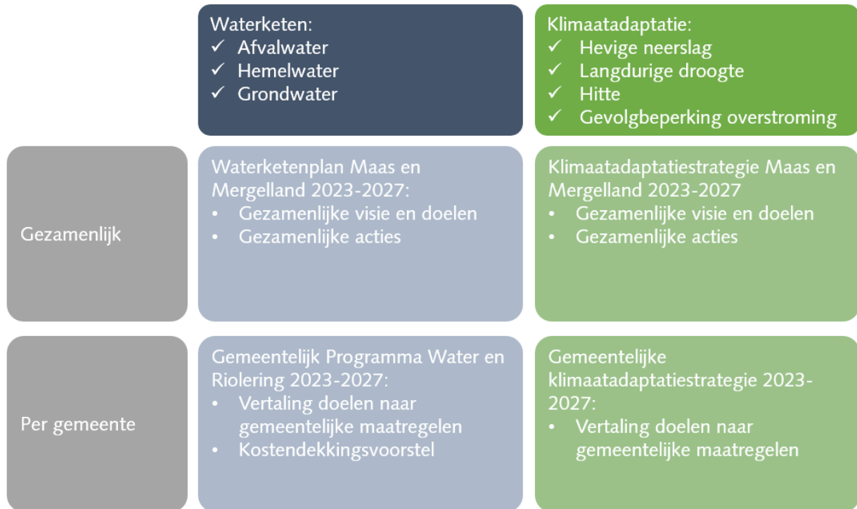
Figuur 1 (voor onze gemeente gelden jaartallen 2024-2027)

Binnen het samenwerkingsverband (Afval)waterbeheer Maas en Mergelland zijn het Waterketenplan, de Waterprogramma's en de Klimaatadaptatiestrategieën opgesteld. (zie figuur 1)