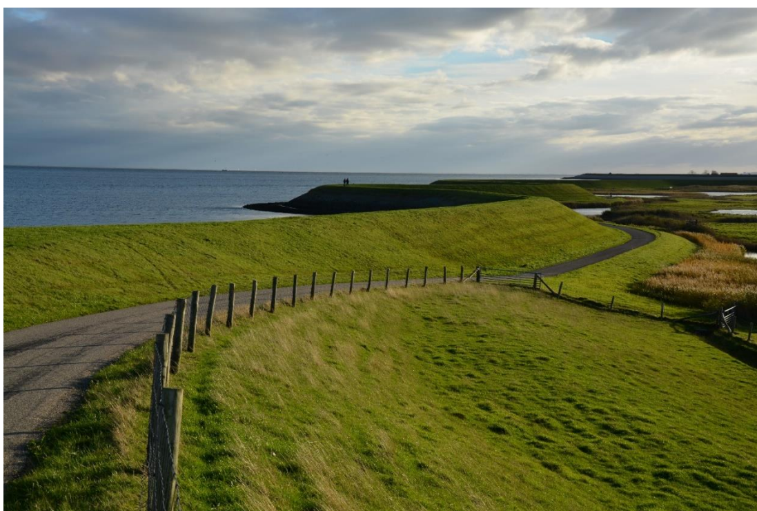
Oude waddendijk, oostkant Texel

Noord-Holland heeft een grote variatie aan landschappen met veel kenmerkende gebouwde en archeologische monumenten. Dit cultuurlandschap vertegenwoordigt een belangrijke economische, maatschappelijke en culturele waarde. Het landschap verandert onder invloed van allerlei ruimtelijke ontwikkelingen en opgaven. Hierbij gaat het om zaken als de verstedelijking van het platteland, veranderende mobiliteit, klimaatadaptatie en energieafspraken, en veranderende productie- en consumptiepatronen. Bovendien zijn er binnen de provincie grote regionale verschillen. In de Metropoolregio Amsterdam (MRA) is er bijvoorbeeld een grote opgave in woningbouw, terwijl er in Noord-Holland Noord (NHN) sprake is van agrarische schaalvergroting. Hiermee houdt de provincie rekening in het beleid.