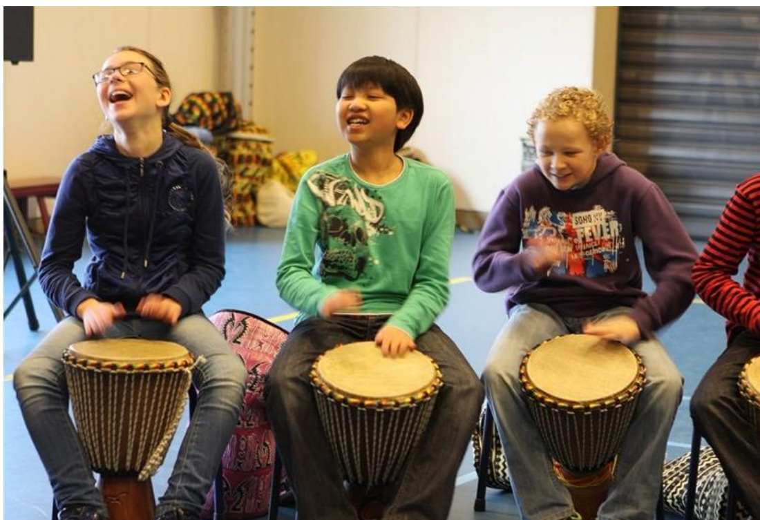
CMK programma muziek in het primair onderwijs.

Plein C werkt voor alle scholen en alle kinderen in Noord-Holland. Bij de provinciale projecten ligt de nadruk enerzijds op verdieping aanbrengen bij deelnemende scholen, onder andere via visievorming en deskundigheidsbevordering van leerkrachten. Anderzijds wordt ingezet op het bereiken van nieuwe scholen, in het bijzonder scholen met onderwijsachterstanden, scholen in achterstandswijken en op locaties met onvoldoende culturele infrastructuur. Dit om de kansengelijkheid van kinderen te vergroten. Ook is er meer ruimte voor maatwerk, zoals aandacht voor het speciaal onderwijs, het vmbo en de relatie binnen-buitenschools.