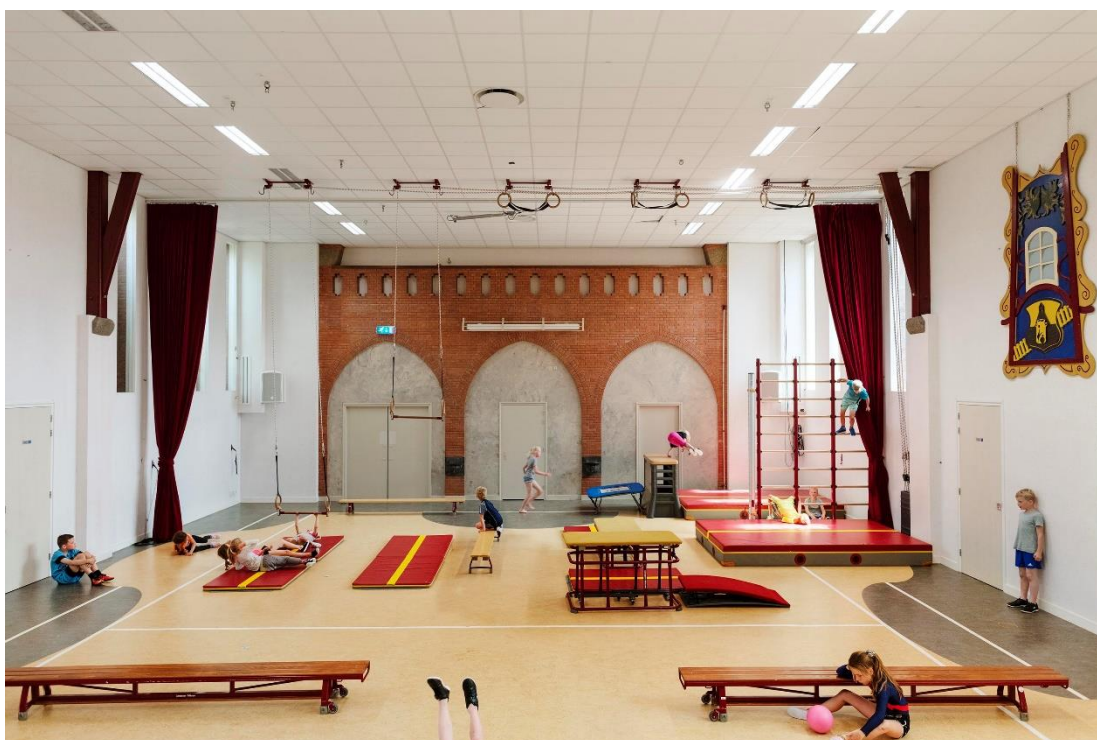
Het dorpshuis in Zuidermeer, voorheen alleen een kerkgebouw, is nu een multifunctioneel gebouw dat onder andere een gymzaal herbergt.

De provincie richt zich de komende jaren op de herbestemming van religieus en agrarisch erfgoed. Bij religieus erfgoed doet zich de verwachte leegstand nog niet op grote schaal voor. Huidige gebruikers willen hun kerk nog niet kwijt. Bij een aantal van hen is wel behoefte aan multifunctioneel gebruik van hun kerk. Het gaat dan niet om herbestemmen, maar om bijbestemmen gericht op publiek gebruik. De kerk blijft dan deel uitmaken van de gemeenschap en wordt door de gebruikers geëxploiteerd. Als dit gebruik een reële kans van slagen heeft, ondersteunt de provincie partijen door de inzet van de Loods Herbestemming. De verwachting is echter dat het grootste deel van de herbestemmingsopgave voor kerken door de markt zal worden opgepakt in de vorm van woonfuncties. Ook hier geldt dat dit in de MRA gemakkelijker zal verlopen dan in het noorden van de provincie. De gebouwen zullen over het algemeen voor het stads- en dorpsbeeld behouden blijven, maar hun maatschappelijke functie verliezen.