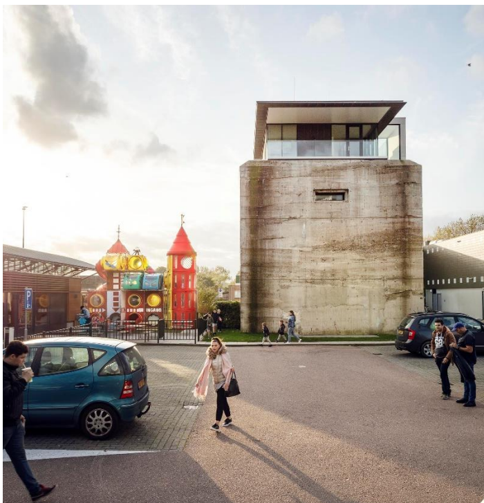
De transformatorbunker in Schagen maakte vroeger deel uit van het verdedigingssysteem van de Atlantikwall, het is nu herbestemd als kantoor.

houden. De provinciale monumentenmonitor zorgt ervoor dat de provincie goed zicht heeft op de (naderende) leegstandsopgave en deze continu monitort. De provincie legt hierbij de relatie met de bredere regionale leegstandsproblematiek, bijvoorbeeld als het gaat om bedrijventerreinen, kantoren en detailhandel. De monitor richt zich in eerste instantie op rijksmonumenten zonder woonfunctie en op provinciale monumenten. Op hoofdlijnen wil de provincie ook inzicht krijgen in de opgave onder gemeentelijke monumenten en ander karakteristiek vastgoed. Deze kennis wordt met de gemeenten gedeeld om die bewust te maken van de gemeentelijke leegstandsopgave en te stimuleren hier tijdig (ruimtelijk) beleid voor te ontwikkelen. Daarnaast geeft de monumentenmonitor inzicht in het energieverbruik van monumenten. Zo monitort de provincie het daadwerkelijke verbruik van monumenten en signaleert kansen om het verbruik te verminderen en om te verduurzamen.