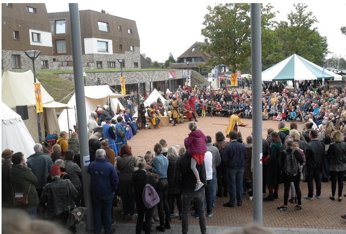
Het jaarlijkse evenement 'Hilde's verjaardag' trekt veel bezoekers.

Om de provinciale collectie breed toegankelijk en up-to-date te maken voor wetenschap en publiek verschijnt jaarlijks de archeologische kroniek van Noord-Holland, waarin archeologische ontdekkingen en bijzondere opgravingen centraal staan. Ook is de hele archeologische collectie online te raadplegen. Daarnaast verschijnen in een reeks archeologische publicaties regelmatig nieuwe uitgaven over archeologische opgravingen en onderzoek in de regio. Deze uitgaven lopen uiteen van basisrapportages van oud of recent archeologisch onderzoek (wettelijke plicht), tot rijk geïllustreerde publieksbrochures ter ondersteuning van tentoonstellingen en publieksboeken. In Huis van Hilde is een ArcheoHotspot gevestigd waar bezoekers kunnen meewerken aan archeologisch onderzoek.