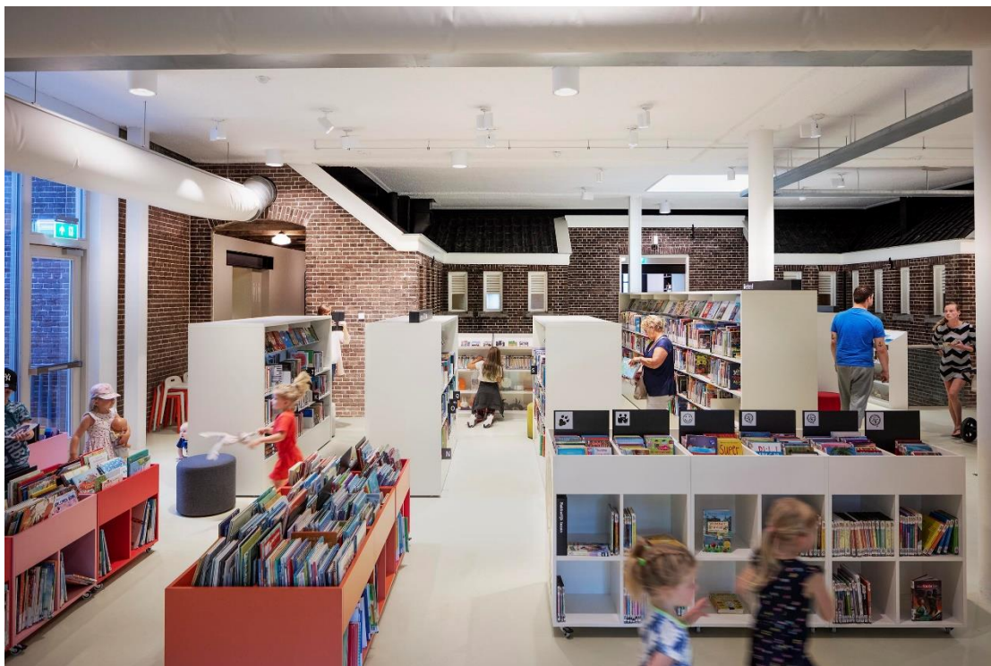
De bibliotheek 'School 7' in Den Helder is gevestigd in de zevende gemeenteschool uit 1905, een gemeentelijk monument.

Onder de netwerkverantwoordelijkheid verstaat de provincie dat lokale bibliotheken kunnen profiteren van landelijke trajecten, zoals de digitale infrastructuur en een landelijk collectiebeleid. Daarbij biedt de provincie ondersteuning aan de vorming van een provinciaal bibliotheeknetwerk, waarin bibliotheken uitvoering geven aan programma's op basis van de prioriteiten van de landelijke netwerkagenda. De provincie vraagt aan Probiblio het regionale bibliotheeknetwerk te ondersteunen, te inspireren en uit te dagen tot vernieuwing.