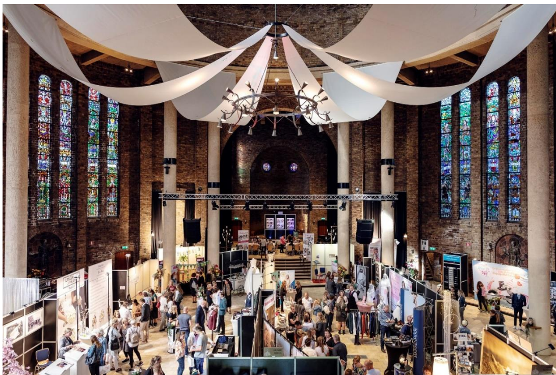
Cultuurkoepel in Heiloo

In NHN hebben de drie deelregio's (Kop van Noord-Holland, West-Friesland en Alkmaar) met financiële steun van de provincie het regionaal cultuurprofiel Zee aan ruimte, land vol cultuur opgesteld. Provincie Noord-Holland heeft dit proces met subsidie mogelijk gemaakt en ambtelijk ondersteuning geboden. Het cultuurprofiel dient als basis voor een nauwere samenwerking binnen NHN op gebied van cultuur en moet de regio meer zichtbaarheid geven in het landelijk beleid. Daarom ondersteunt de provincie de komende jaren de concretisering van het cultuurprofiel. Ook voert de provincie samen met de kernsteden van NHN een lobby richting Rijk en de landelijke cultuurfondsen met als doel de erkenning van NHN als 16 e stedelijke cultuurregio in het rijksbeleid.