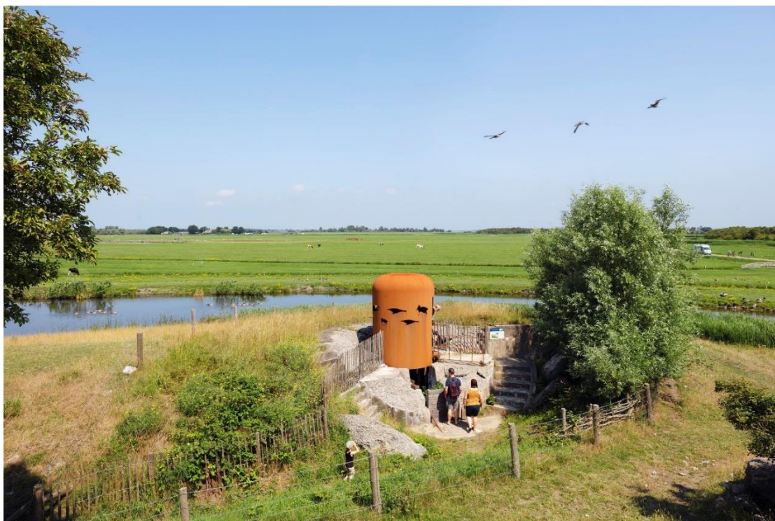
Fort K'ijk bij Uitgeest, een fort dat innovatieve en duurzame nieuwe functies heeft gekregen. (foto: Martin van Lokven)

De provincie versterkt het behoud en het gebruik van de structuren door kennis erover te delen en door kennisnetwerken op te zetten. De provincie biedt informatie via de Monumentenmonitor Noord-Holland, de Noord-Hollandse Waarderingskaart voor stolpboerderijen en de Wegwijzer monumenten . De provincie houdt deze instrumenten up-to-date. Daarnaast deelt de provincie kennis met partners via een kennisbank en via het Steunpunt Monumenten en Archeologie. Verder organiseert de provincie netwerkbijeenkomsten, zoals de jaarlijkse Molencontactdag en de netwerkdagen voor verduurzaming, herbestemming en restauratie van monumenten.