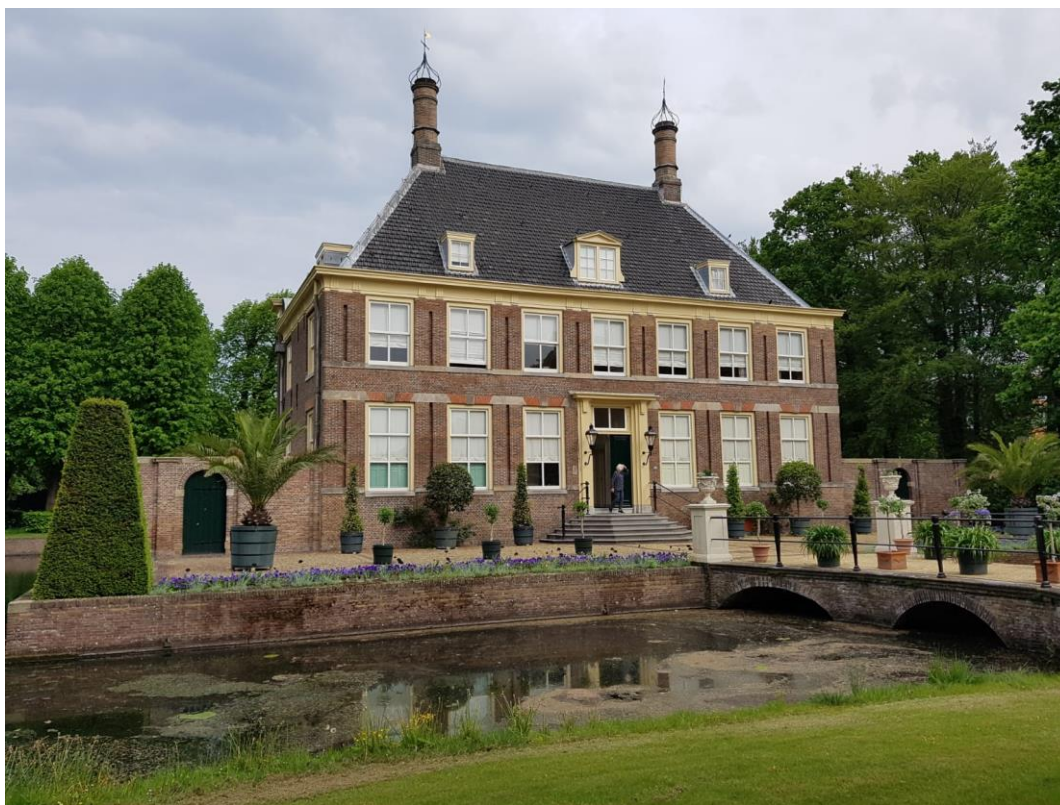
Buitenplaats Akerendam in Beverwijk is aangelegd in 1636 door de Amsterdamse koopman Jan Bicker en lag vroeger aan het Wijkermeer.

POM's zijn in staat om complexe restauratie-, herbestemmings- en verduurzamingsopgaven te realiseren en het resultaat als onderdeel van hun monumentenbezit te beheren. De provincie ondersteunt de POM's met gunstige subsidievoorwaarden voor restauraties. Daarnaast wil de provincie met de POM's en de (erfgoed-)ANBI's werken aan een gunstig toekomstperspectief voor religieus erfgoed dat een maatschappelijke functie blijft behouden. De provincie richt zich op een oplossing waarbij de ANBI's zich kunnen concentreren op programmering en uitvoering van activiteiten en de POM's op de instandhouding van het erfgoed door overname. De Loods Herbestemming stimuleert dit proces.