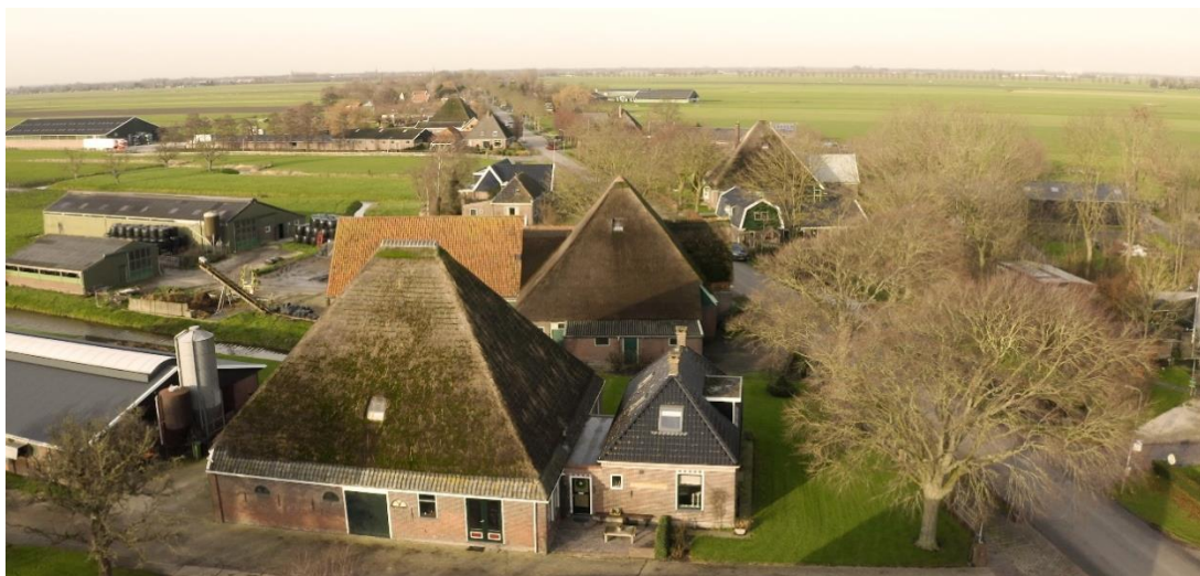
Stolpenstructuur te Wijdenes.

vergunningplicht in gesprek met eigenaren die sloop overwegen. De procedure van een sloopvergunning draagt ertoe bij dat er meer tijd is om inzicht te krijgen in de bouwhistorische waarden die verloren zouden kunnen gaan en nader onderzoek te doen naar de bouwtechnische staat en de mogelijkheden voor herbestemming en verduurzaming. Over de wenselijkheid van het invoeren van een vergunningstelsel voor sloop van historische stolpboerderijen en de gevolgen ervan zal de provincie in overleg treden met alle gemeenten in Noord-Holland.