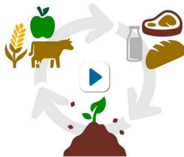
Afb. bron: rvo

Kringlooplandbouw is door de rijksoverheid als de landelijke landbouwopgave uitgedragen in de “Visie Landbouw, Natuur en Voedsel: Waardevol en Verbonden”: “Bij kringlooplandbouw komt zo min mogelijk afval vrij, is de uitstoot van schadelijke stoffen zo klein mogelijk en worden grondstoffen en eindproducten met zo min mogelijk verliezen benut” (citaat website rvo). In afbeelding als volgt weergegeven: