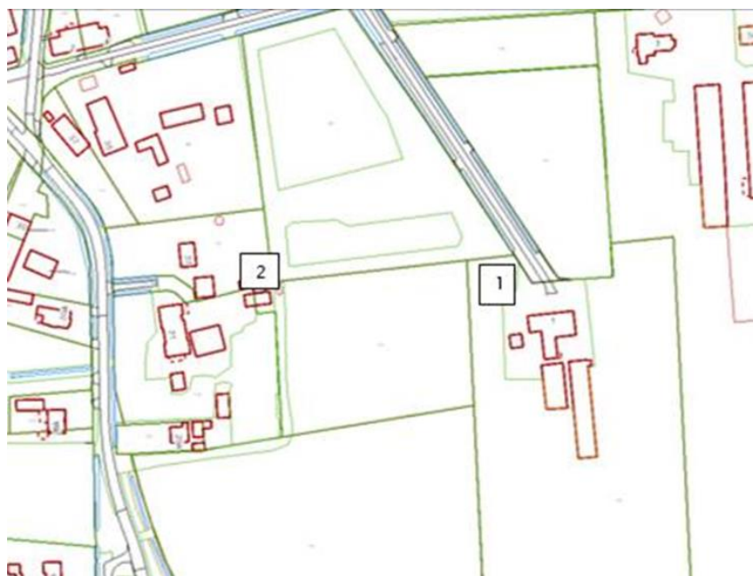
Figuur 3 meetpunten voorgrondberekening

Als x,y coördinaten zijn de grens bouwblok Venstraat 1 en de bouwblokgrens van het plangebied ingesteld. Voor de dieraantallen is uitgegaan van 600 vleesvarkens gehuisvest op het traditionele stalsysteem D3.1. Uit de rekenresultaten blijkt dat de invloed van de varkenshouderij Venstraat 1 op de bouwblokgrens van het plangebied 4,0 OU/m 3 is. Dat is lager dan de geldende norm van 8 OU/m 3 van de geurverordening.