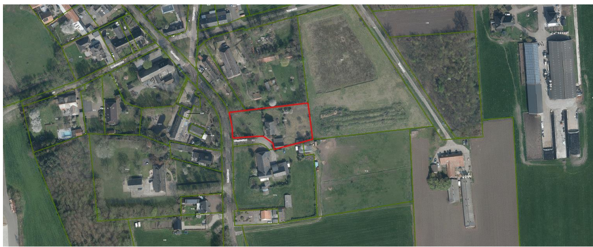
Figuur 1 situering planontwikkeling

In 2020 heeft de gemeenteraad van Uden de Visie Lankes vastgesteld. Op basis van deze visie kunnen ontwikkelingen plaatsvinden. De initiatiefnemer op Nieuwstraat 33 te Volkel gaat van deze mogelijkheid gebruik maken. De initiatiefnemer is voornemens om zijn bestaande burgerwoning met garage te slopen en een nieuwe erfontwikkeling te realiseren overeenkomstig de uitgangspunten van de visie. Initiatiefnemer wil een hoofdgebouw oprichten bestemd voor één woning alsmede twee bijgebouwen realiseren waarvan één extra woning. Voor deze gewenste ontwikkeling is het van belang dat de geursituatie in beeld wordt gebracht.