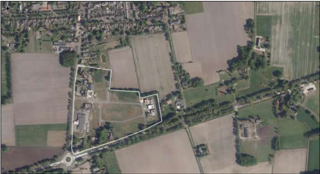
Figuur 9. Luchtfoto van de onderzoekslocatie en directe omgeving.