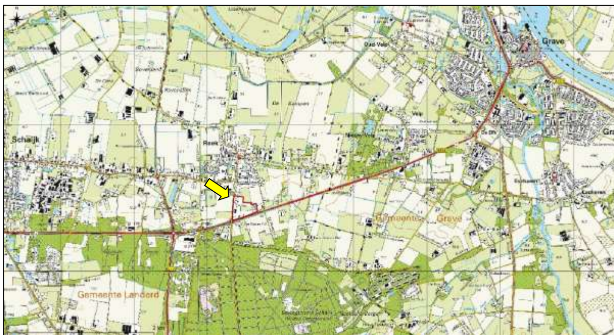
Figuur 1. Topografische ligging van de onderzoekslocatie.

Volgens de topografische kaart van Nederland zijn de coördinaten van het midden van de onderzoekslocatie X = 175.502 , Y = 416.811 . In figuur 1 is de topografische ligging van de onderzoekslocatie weergegeven.