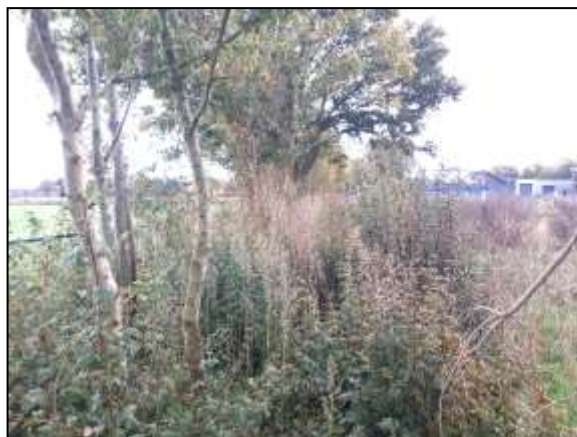
Figuur 12. Noordoostelijke rand van de onderzoekslocatie met opgaand groen en ondergroei. Op de grens staat geen ontwikkeling gepland.