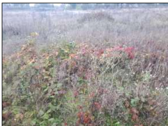
Figuur 13. Ook in het midden van de onderzoekslocatie is dekking aanwezig wat een functie kan hebben voor kleine marterachtigen.

De kleine marterachtigen zijn sterk gebonden aan landschapselementen zoals houtwallen en boschages die dekking bieden gedurende het foerageren en migreren tussen de vaste rust- of voortplantingsplaatsen en de foerageergebieden. Lijnvormige elementen zijn aanwezig langs de randen van de onderzoekslocatie (figuur 11 en 12). Er is hier voldoende ruigte en opgaand groen waargenomen waar kleine marterachtigen dekking kunnen vinden. Daarnaast is er tevens in het midden van de braakliggende terreinen ruigte waargenomen (figuur 13 en 14) met daarnaast muizen- en mollenholen waar soorten als hermelijn en wezel gebruik van kunnen maken als vast rust- en voortplantingsplaats. Een negatief effect als gevolg van de nieuwbouw is niet op voorhand uit te sluiten (zie hoofdstuk 6).