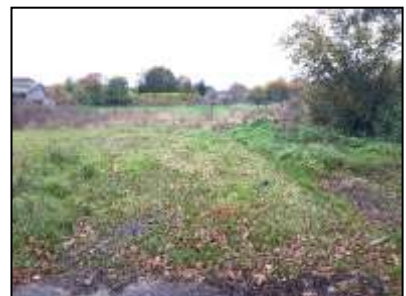
Figuur 8. Uitloop van de Wagenmakerstraat.