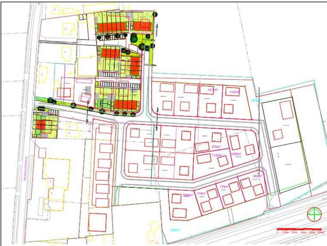
Figuur 10. Plan van woning en bedrijventerrein Reek-Zuid.

De initiatiefnemer is voornemens het complete perceel te bebouwen met woningen en bedrijfspanden. Zie figuur 10. De ontwikkeling is reeds gaande.