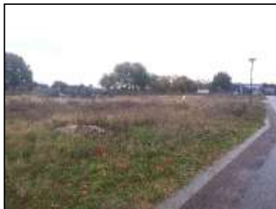
Figuur 4. Perceel achter Voermanstraat 3 (in aanbouw).