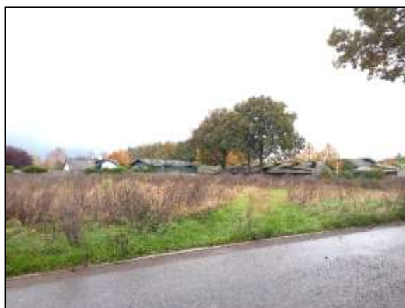
Figuur 14. Ruigte op perceel ten westen van Wagenmakerstraat.