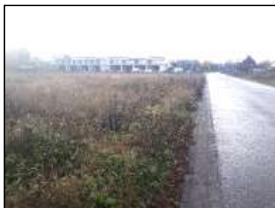
Figuur 7. Van oost naar west gezien terrein in het midden van planlocatie met Radmakerstraat in aanbouw op de achtergrond.