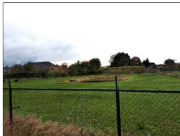
Figuur 15. Waterlichaam ten noorden.

Doordat wateroppervlakten als poelen, sloten en plassen op de onderzoekslocatie ontbreken zijn voortplantingsmogelijkheden voor amfibieën op de onderzoekslocatie uitgesloten. De waterpartij op circa 50 meter ten noorden van de onderzoekslocatie is in 2019 ingericht (figuur 15). De (oever)begroeiing was ten tijde van het veldbezoek niet optimaal, echter kan dit in het voorjaar er anders uit zien. Een soort als de alpenwatersalamander kan gebruik maken van de waterpartij als voortplantingswater, daar deze soorten niet kritisch is. In het geval de alpenwatersalamander gebruik maakt van de waterpartij als voortplantingswater, dan is de aanwezigheid van landhabitat op de onderzoekslocatie niet uitgesloten (zie hoofdstuk 6).