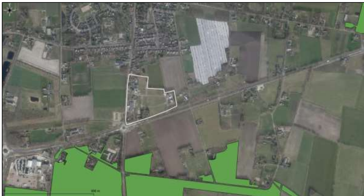
Figuur 18. Ligging onderzoekslocatie (wit omkaderd) ten opzichte van het Natuurnetwerk Nederland.

De onderzoekslocatie maakt geen deel uit van het Natuurnetwerk. De onderzoekslocatie ligt echter wel in de nabijheid van een gebied, behorend tot het Natuurnetwerk Nederland. Het meest nabijgelegen gebied bevindt zich circa 250 meter ten noorden van de onderzoekslocatie. In figuur 18 is de ligging van de onderzoekslocatie ten opzichte van het Natuurnetwerk Nederland weergegeven.