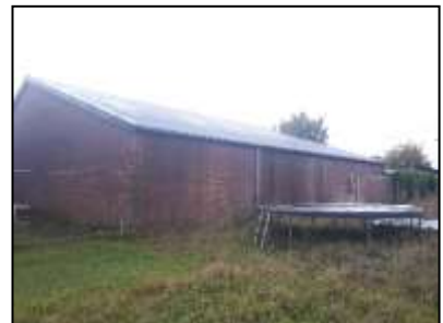
Figuur 5. Te behouden schuur achter Voermanstraat 3b.