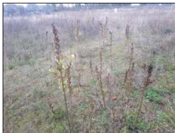
Figuur 16. Teunisbloemen op de onderzoekslocatie.

Volgens verspreidingsgegevens komen de teunisbloempijlstaart en grote vos in de omgeving van de onderzoekslocatie voor. Beschermden vlinders stellen specifieke eisen aan het voortplantingshabitat. Bij het habitat is het belangrijk dat aan de eisen van alle stadia van de vlindersoort wordt voldaan. Voor de beschermde soorten in Nederland geldt dat deze veelal gebonden zijn aan specifieke waardplanten. Op de onderzoekslocatie is de waardplant van de teunisbloempijlstaart (wilgenroosje, teunisbloem, basterdwederik en kattenstaart) waargenomen (figuur 16). Deze planten zullen bij de herontwikkeling verdwijnen en daarmee, bij aangetoonde aanwezigheid van een populatie van de teunisbloempijlstaart resulteren in een negatief effect. Ten aanzien van waardplanten van de grote vos (iep, zoete kers en sommige wilgensoorten) zijn deze op de onderzoekslocatie niet aanwezig of blijven deze behouden. Naar de aanwezigheid van de teunisbloempijlstaart is aanvullend onderzoek aan de orde (zie hoofdstuk 6).