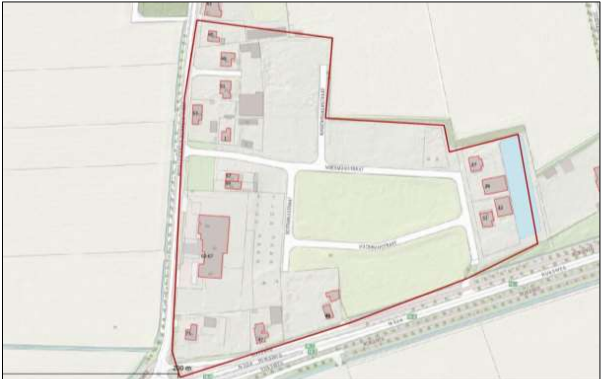
Figuur 2. Onderzoekslocatie met nummeraanduiding.