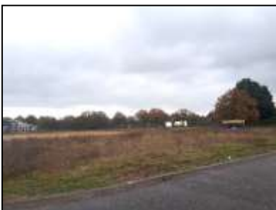
Figuur 6. Overzicht braakliggend terrein in het midden van de planlocatie.