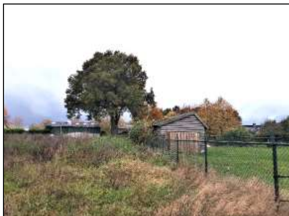
Figuur 11. Wagenmakerstraat met ruigte. Hier staat nieuwbouw gepland.

vorm van opgaand groen, wat een functie kan hebben voor de steenmarter (figuur 11 en 12). Omdat er op en nabij deze randen een ontwikkeling gepland staat is een negatief effect niet op voorhand uit te sluiten (zie hoofdstuk 6).