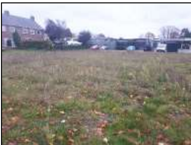
Figuur 3. Perceel voor Mgr. Borretstraat 57-59.