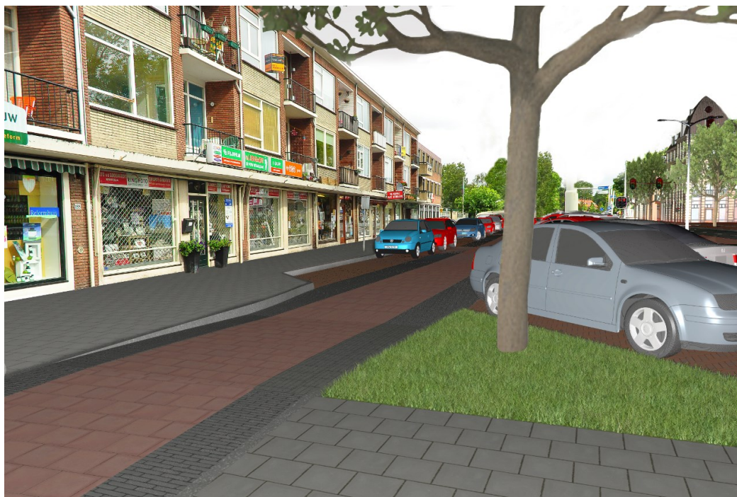
Figuur: impressie van de fietsstraat in de ventweg Schoolstraat. De totale fietsstraat is 4 meter breed. De schampstrook tussen de achteruit rijdende auto's (schuinparkeren) is 1,4 meter breed. Het fietspad zelf is 2 meter breed.

De fietsstraat is besproken met de Fietsersbond Voorschoten en door deze organisatie akkoord bevonden.