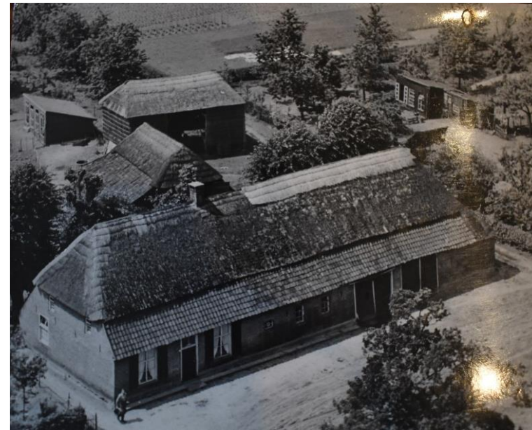
Dorshout 5 vóór 1974.

De boerderij is opgetrokken vanuit een rechthoekige plattegrond met baksteen in een vrij verband met een cementvoeg, onder een schilddak met aan op de kopgevel van het woongedeelte een wolfseind. Ter hoogte van de brandmuur staat een vernieuwde schoorsteen. Boven het oorspronkelijke bedrijfs gedeelte staat een tweede, later toegevoegde, schoorsteen.