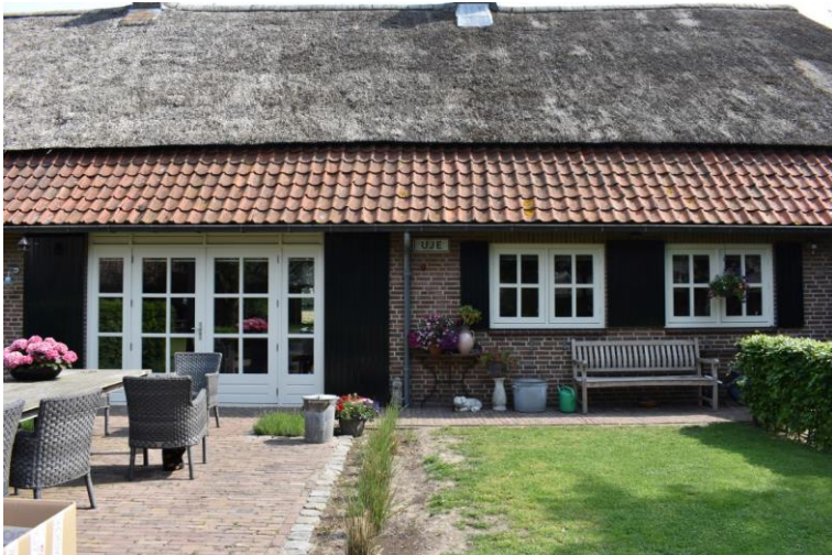
Achtergevel van het woongedeelte.