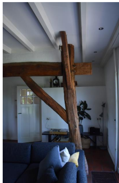
Ankerbalkgebint in woonkamer.