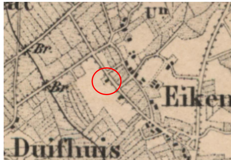
Topografische militaire kaart van 1850. De vermoedelijke locatie van de voorganger van Dorshout 5 is rood omcirkeld. Het is echter bekend dat deze kaarten niet altijd even nauwkeurig waren.