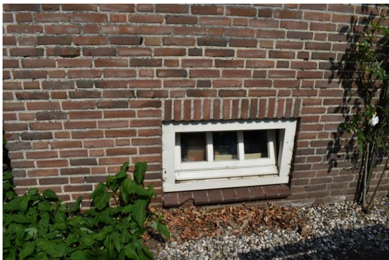
Keldervenster in de linkerzijgevel.