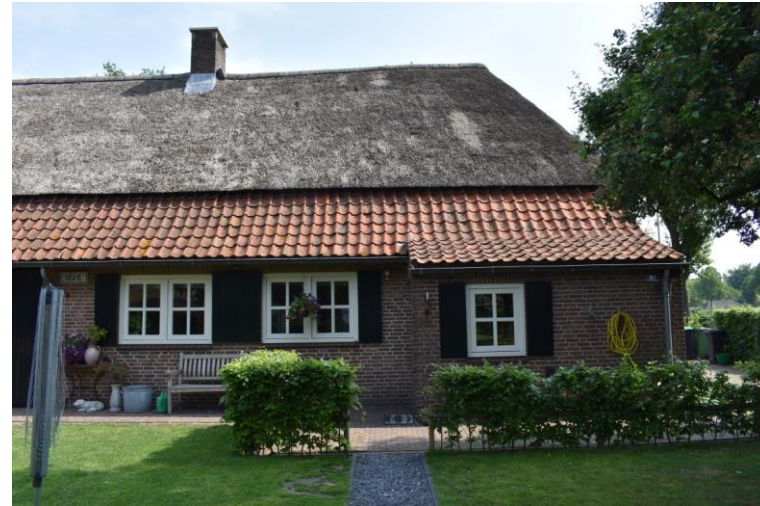
Achtergevel van het woongedeelte.