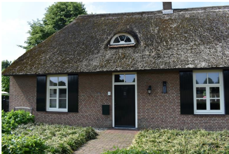
Voorgevel van het woongedeelte.