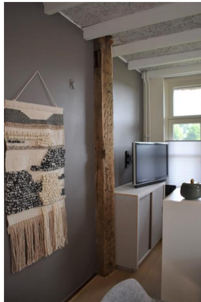
Staander in het kantoor.