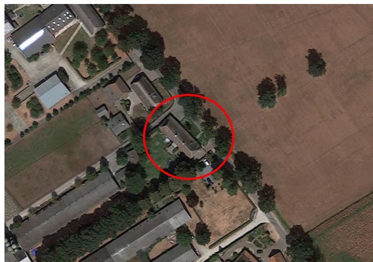
De rode cirkel wijst Dorshout 5 aan.