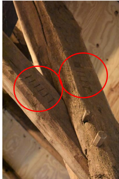
Ankerbalkgebint met telmerk IIIIII.