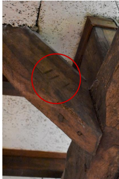
Dekbalkgebint met telmerk III.