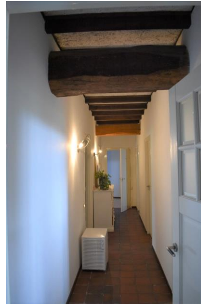
Gang met aan weerszijde kamers.