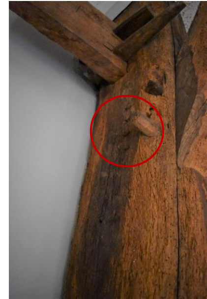
Ankerbalkgebint met telmerk III.