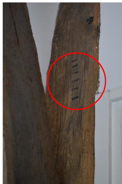
Ankerbalkgebint met telmerk IIIIII.