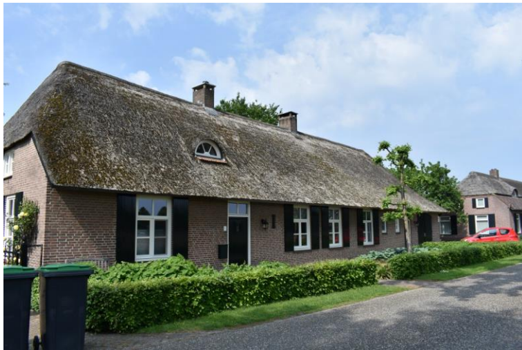
Voorgevel van de boerderij.