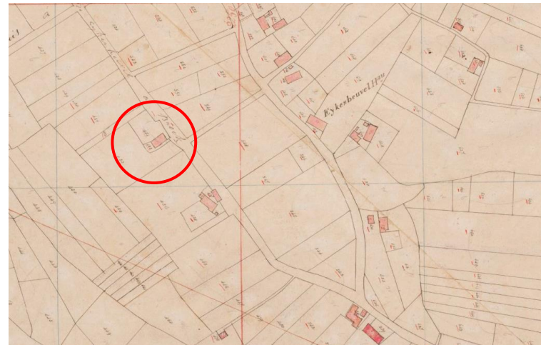
Kadastrale kaart 1811-1832, minuutplan Uden, sectie I, blad 02.