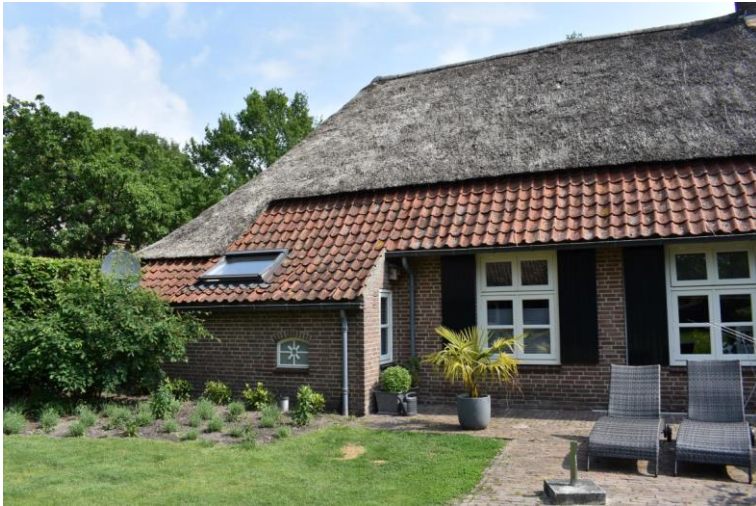
Achtergevel van het bedrijfsgedeelte.