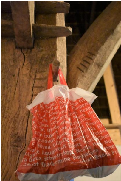
Ankerbalkgebint met telmerk IIIII.