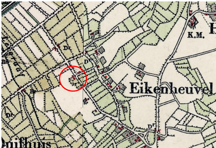
Topografische militaire kaart van 1899. De vermoedelijke locatie van Dorshout 5 is rood omcirkeld. Het is echter bekend dat deze kaarten niet altijd even nauwkeurig waren.

De boerderij is opgetrokken vanuit een rechthoekige plattegrond met baksteen in een vrij verband met een cementvoeg, onder een schilddak met aan op de kopgevel van het woongedeelte een wolfseind. Ter hoogte van de brandmuur staat een vernieuwde schoorsteen. Boven het oorspronkelijke bedrijfs gedeelte staat een tweede, later toegevoegde, schoorsteen.