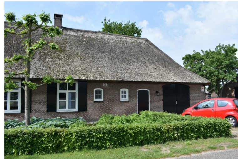
Voorgevel van het bedrijfsgebouw.