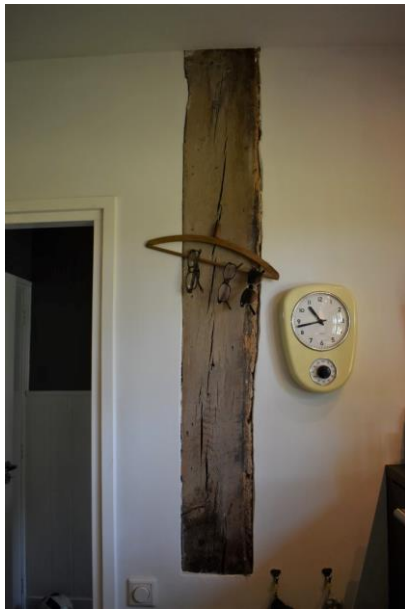
Staander in de keuken.

betimmering is aangebracht. Het overige gedeelte van de verdieping is in gebruik als zolder. Hier is de kapconstructie goed zichtbaar. Op de wormplaten, die beide enkele liplassen bevatten om de volledige lengte van de boerderij te kunnen overbruggen, staan de daksporen. Over de sporen liggen de rietlatten waarop de rieten dakbedekking bevestigd is. De oorspronkelijke brandmuur is niet meer aanwezig, maar de locatie hiervan wordt nog wel gemarkeerd door de schoorsteen die in de jaren '70 van de twintigste eeuw opnieuw is opgemetseld.