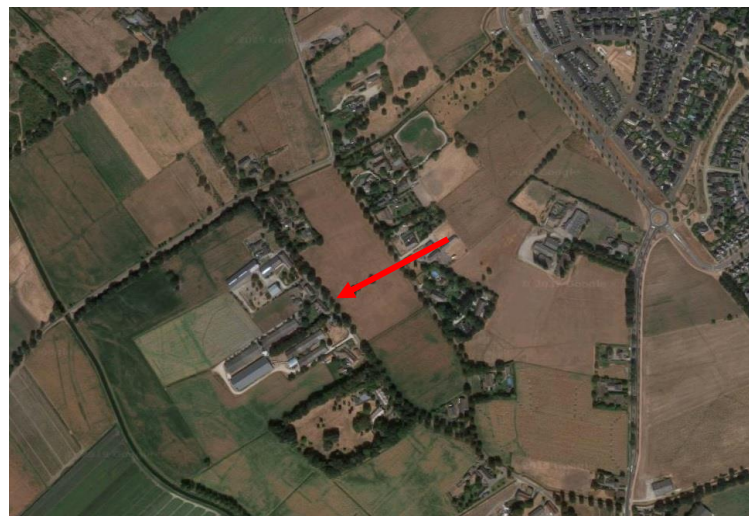
De rode pijl wijst Dorshout 5 aan.

Ten zuidwesten van de stad Uden staat op Dorshout 5 een boerderij uit 1856 op de locatie van een oudere voorganger. De boerderij behoort tot het buurtschap Eikenheuvel, wat bestaat uit de straten Eikenheuvelweg en Dorshout die parallel aan het riviertje de Leijgraaf lopen. Deze structuur van langgerekte wegen parallel aan een belangrijke watergang is kenmerkend voor het broeklandschap, ontstaan door ontginning van de nattere broekgronden vanaf de late middeleeuwen. De boerderijen aan de Dorshout en de Eikenheuvelweg zijn dicht op de weg en slechts aan de buitenzijde van de wegen gesitueerd, waardoor er een grotendeels onbebouwd binnengebied van akkers en weilanden is ontstaan.