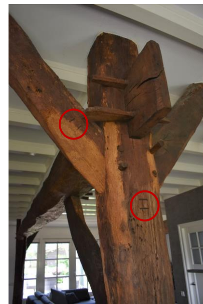
Ankerbalkgebint met telmerk II.