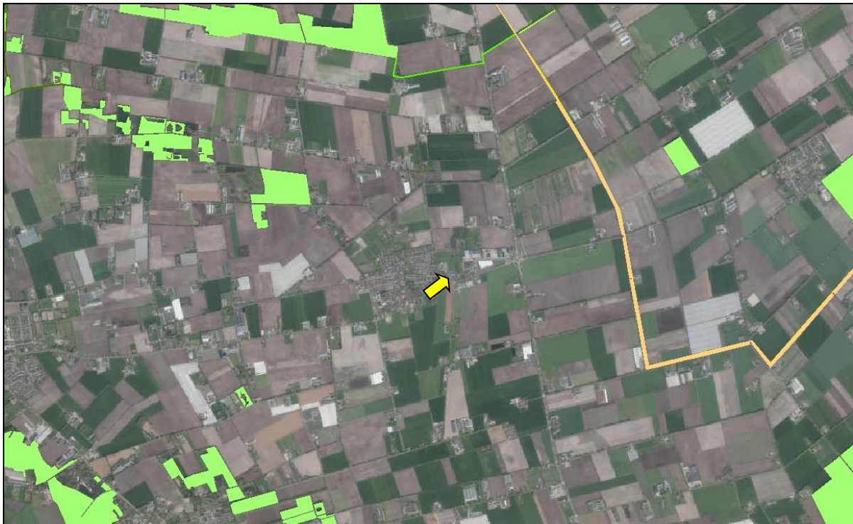
Figuur 10. Ligging onderzoekslocatie (gele pijl) ten opzichte van het Natuurnetwerk Nederland (groen en oranje gearceerd).

De onderzoekslocatie maakt geen deel uit van het Natuurnetwerk. De onderzoekslocatie ligt ook niet in de nabijheid van een gebied, behorend tot het Natuurnetwerk Nederland. Het meest nabijgelegen gebied bevindt zich circa 1,5 kilometer ten noordwesten van de onderzoekslocatie. Het betreft natuurgebied Voskuilenheuvel. In figuur 10 is de ligging van de onderzoekslocatie ten opzichte van het Natuurnetwerk Nederland weergegeven.