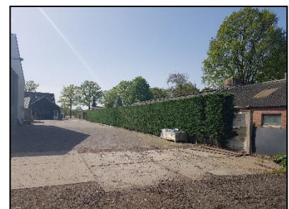
Figuur 8. Coniferenhaag ten westen van de onderzoekslocatie.