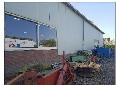
Figuur 5. Aangrenzende loods.