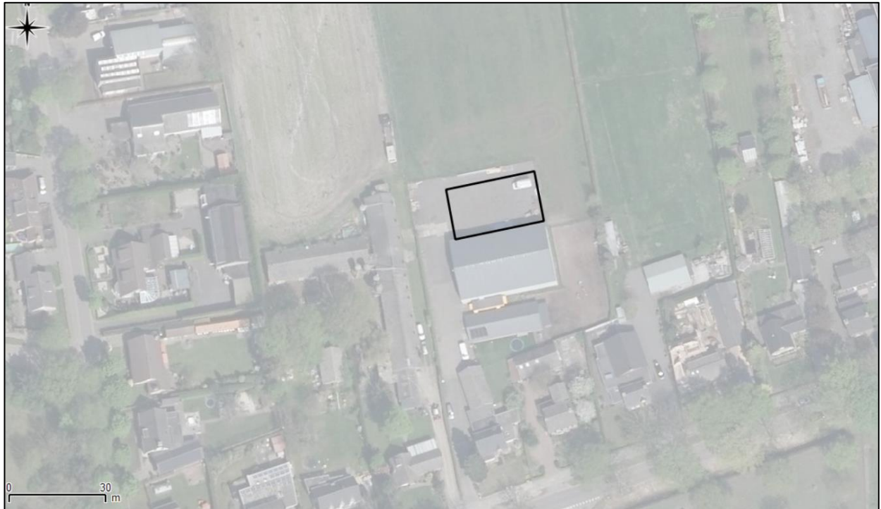
Figuur 2. Luchtfoto onderzoekslocatie en directe omgeving.