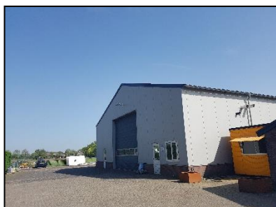
Figuur 6. Aangrenzende loods.