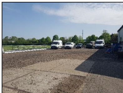
Figuur 3. Oostzijde van de onderzoekslocatie.