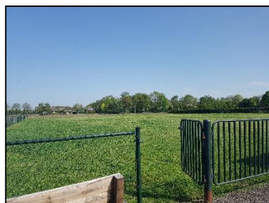
Figuur 7. Weiland ten noorden van de onderzoekslocatie.