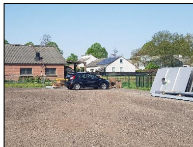
Figuur 4. Westzijde van de onderzoekslocatie.