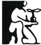
Bijlage 1: Afgebakend gebied BIZ Naaldwijk