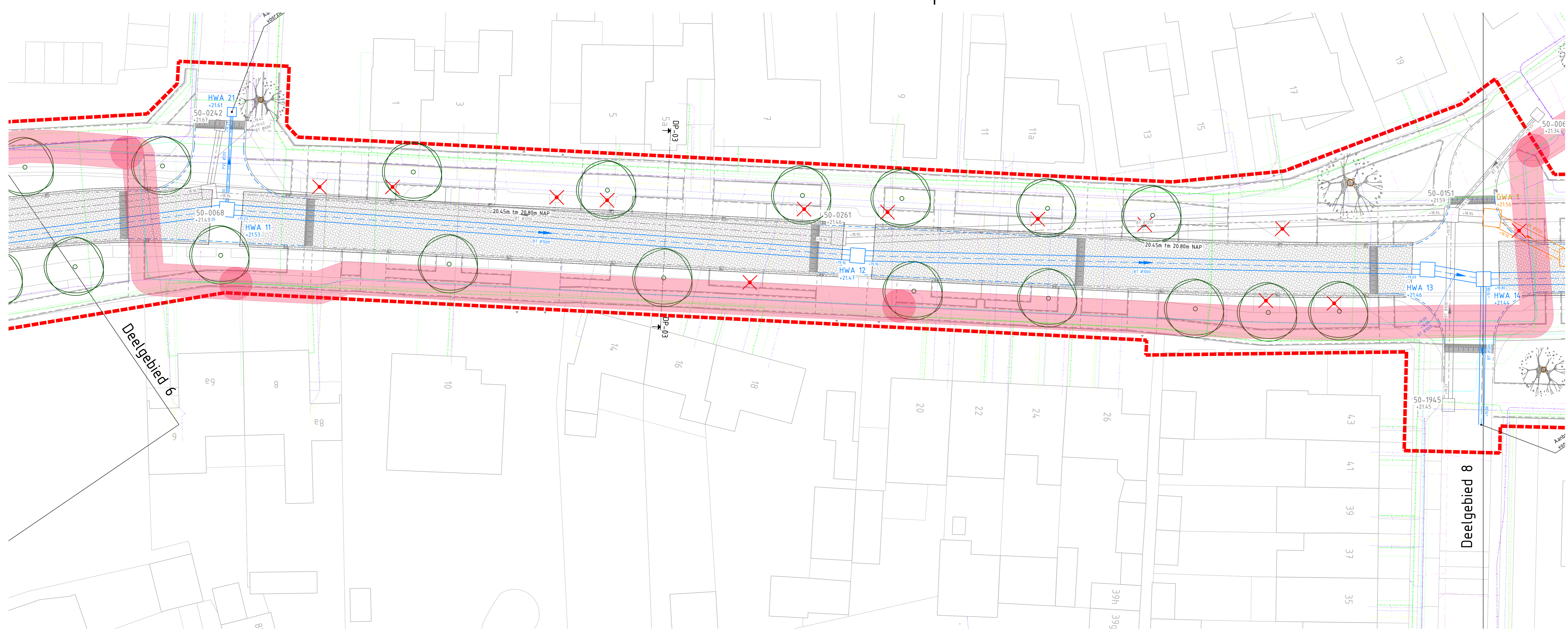
Deelgebied 7 Schaal 1 : 200