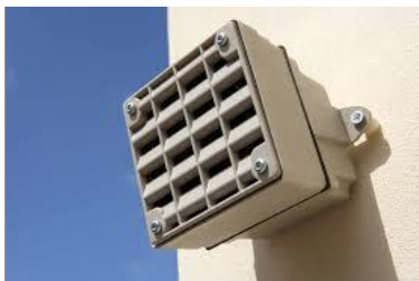
Fig: Een professioneel systeem tegen hanggroepjongeren dat vaak in de openbare ruimte wordt gebruikt

Professionele mosquitosystemen zijn in de afgelopen jaren in meer dan 100 gemeenten in de openbare ruimte gebruikt als middel om lokaal overlast van hanggroepjongeren te bestrijden. Doordat locatie, gebruiksfrequentie, tijdstip van gebruik onder 'overheidscontrole' plaatsvindt zijn de negatieve effecten redelijk geborgd, al zijn er ook zeker in dergelijke situaties klachten en (principiële) tegenstanders die vinden dat je goedwillende mensen en jeugdigen zo niet uit de openbare ruimte moet weren. Er zijn ook de nodige gemeenten die daarom het gebruik weer hebben afgeschaald op zelfs stopgezet.