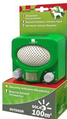
Fig: Een kattenverjager voor particulier gebruik van nog geen € 50

Mosquitosystemen zijn er echter ook in toenemende mate in de handel verkrijgbaar als 'particuliere versie', meestal als doel om katten uit tuinen te weren. Tegenwoordig is een dergelijk apparaat al voor nog geen € 50 te koop voor privégebruik. We hebben sterk het gevoel dat de klachten over het gebruik van dit soort systemen aan het toenemen zijn.