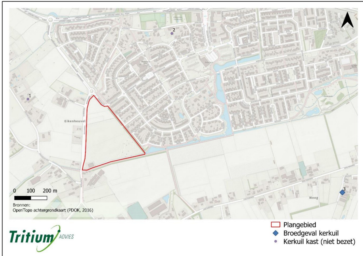
Figuur 3.2: Kaart met aanduiding van de locaties van de kerkuilkasten met of zonder broedgeval in de directe omgeving van het plangebied.

Binnen het plangebied is geen essentieel foerageergebied van de kerkuil aanwezig. Er is in de omgeving voldoende foerageergebied aanwezig in de vorm van akker- en weilanden.