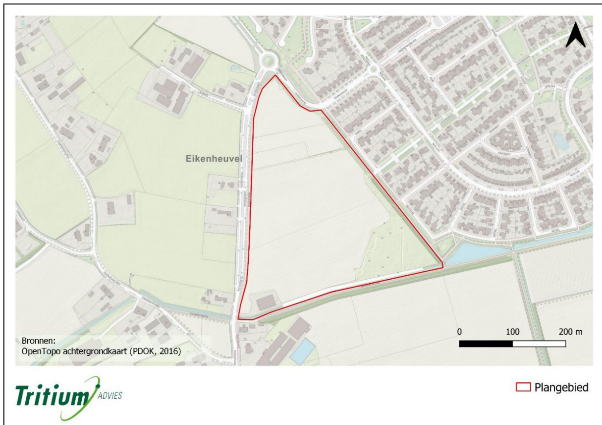
Figuur 2.1: kaart met de begrenzing van het plangebied (rood omlijnd)

Het voornemen bestaat om op locatie de Ruiters te Uden een nieuwbouwwijk te realiseren. De oppervlakte van het plangebied bedraagt circa 90.000 m 2 . Het plangebied was in gebruik als akkerland. In de huidige situatie bestaat het plangebied uit braakliggend terrein met de aanwezigheid van bouwmaterialen en kruidenrijke begroeiing aan de randen. In het zuidelijk deel zijn een kruidenrijk grasland met braamstruweel, solitaire bomen en een schuur aanwezig.