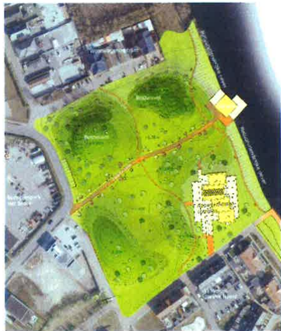
Inrichtingsplan Park de Meeris

Vanaf maandag 18 april worden bouwhekken en bouwketen geplaatst. Bouwverkeer bereikt de bouwlocatie via de Van Dijklaan over bedrijventerrein 't Broek. De aannemer start begin mei 2016 met het ontgraven en verplaatsen van grond en stortmateriaal. De vuilstort ligt dan gedeeltelijk open. De werkzaamheden worden zorgvuldig uitgevoerd. Er wordt een gat gegraven voor de parkeerkelder onder het appartementencomplex. In de tweede helft van mei 2016 worden de heipalen voor het complex aangebracht. Dit zal circa twee weken duren, waarna het complex gebouwd kan worden.