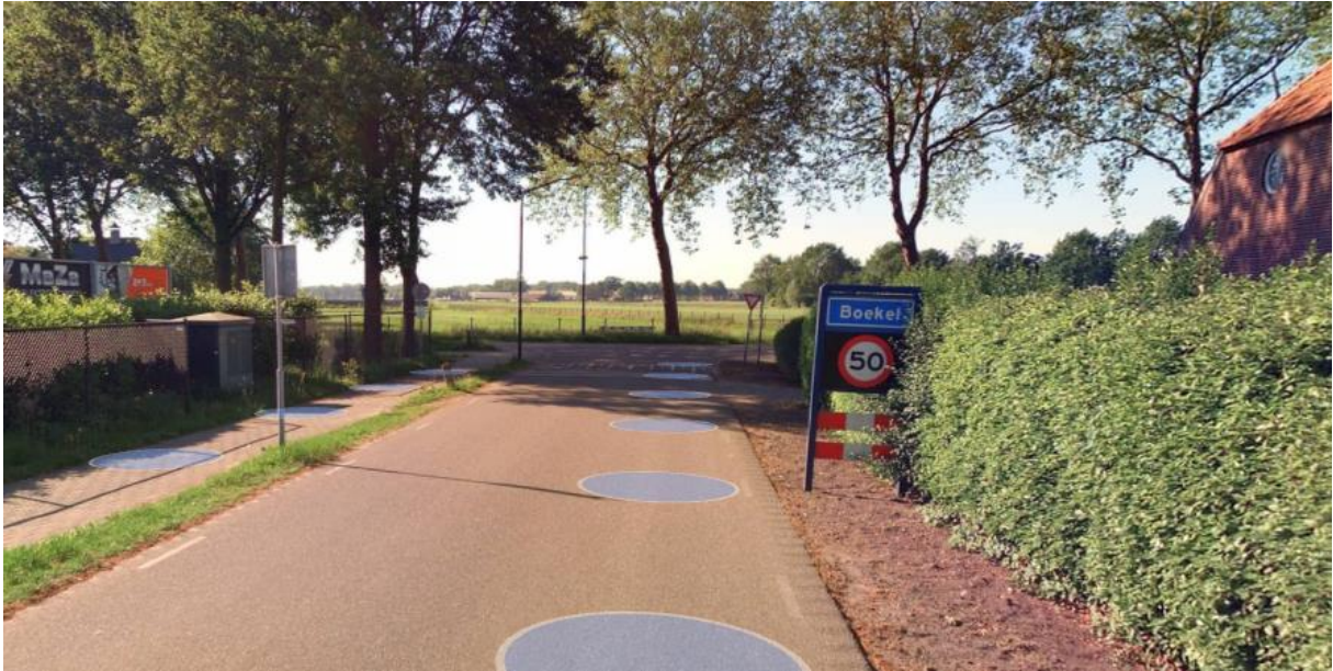
Bijlage 3 Nieuwe locatie kombord