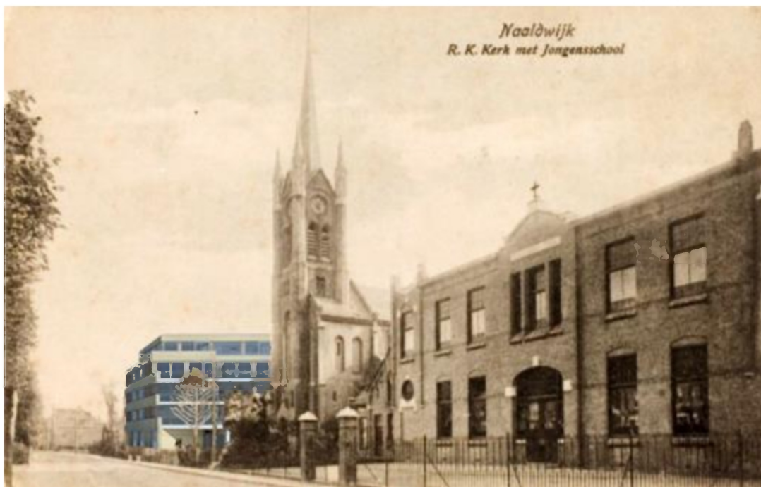
Zicht op de oude historische Ansichtkaart vanaf de Molenstraat richting De Harmonie met de oude R.K. Kerk en de oude Leonardusschool, beide gesloopt.

Om te illustreren hoe bijna naadloos de nieuwe Harmonie aansluit bij de omgeving, laten wij 2 impressies zien waarbij het nieuwe gebouw is in gemonteerd in de historische Ansichtkaarten zoals hierboven is getoond. Oordeelt u zelf. Alsof het er altijd gestaan heeft. Als laatste is het ontwerp te zien zoals wij dat voor ogen hebben op de locatie.