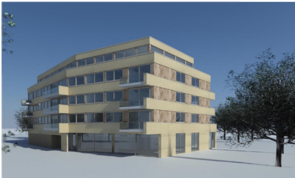
Impressie van De Harmonie anno 2019 op de hoek Verdilaan – Dijkweg

HET architectenbureau René J.M. Hoek architect