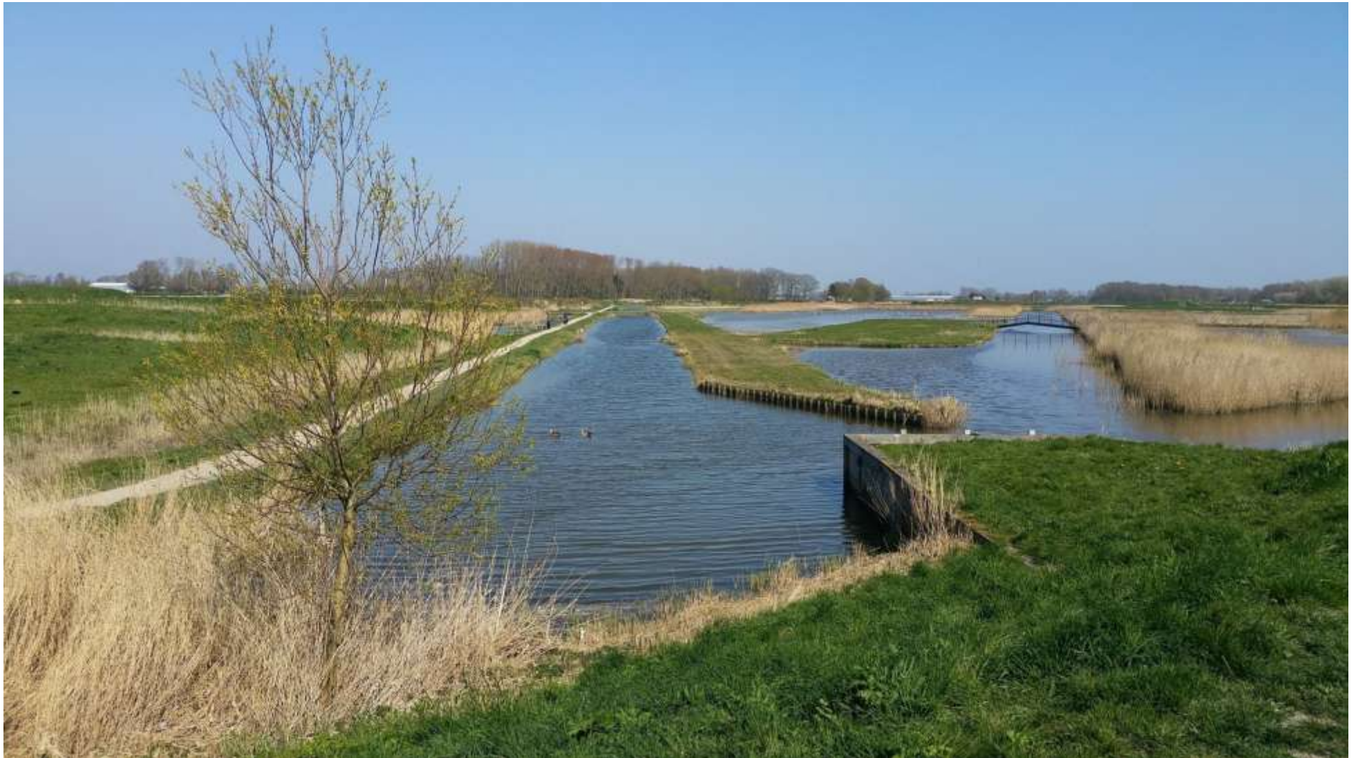
Figuur 7 Uitzicht over De Druppels bij Koedijk