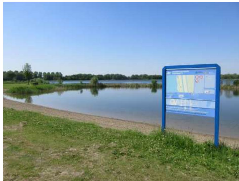
Figuur 3 Een van de zwembaaier bij de Zomerdel