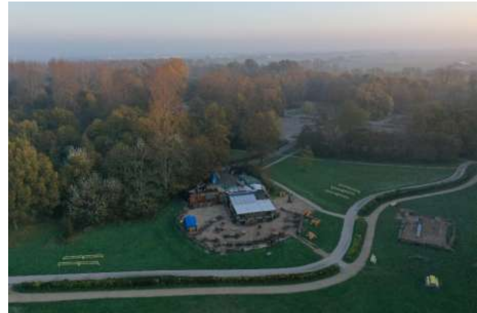
Figuur 9 Luchtfoto in de morgen van paviljoen El Chiringuito

Het kengetal "structurele exploitatieruimte" geeft aan hoe groot de structurele vrije ruimte in de begroting is om tegenvallers op te vangen. De commissie BBV geeft aan dat een ratio > 0,6% acceptabel is.