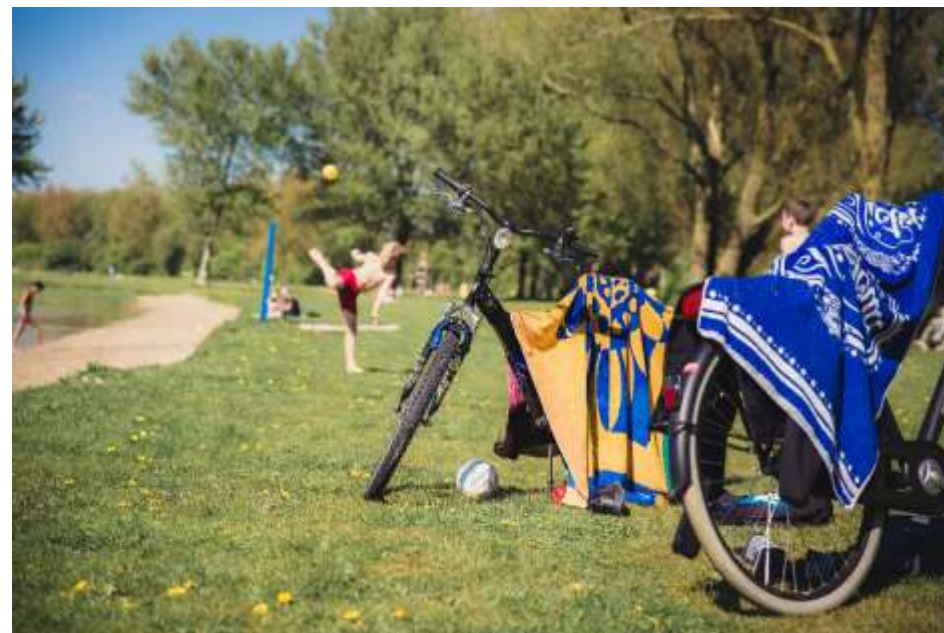
Figuur 8 Spelende kinderen bij zwembad - Zomerdel

Over de jaren 2028 tot en met 2030 is gerekend met een indexatie van 6,30% (gemiddelde NHN index 2023-2025).