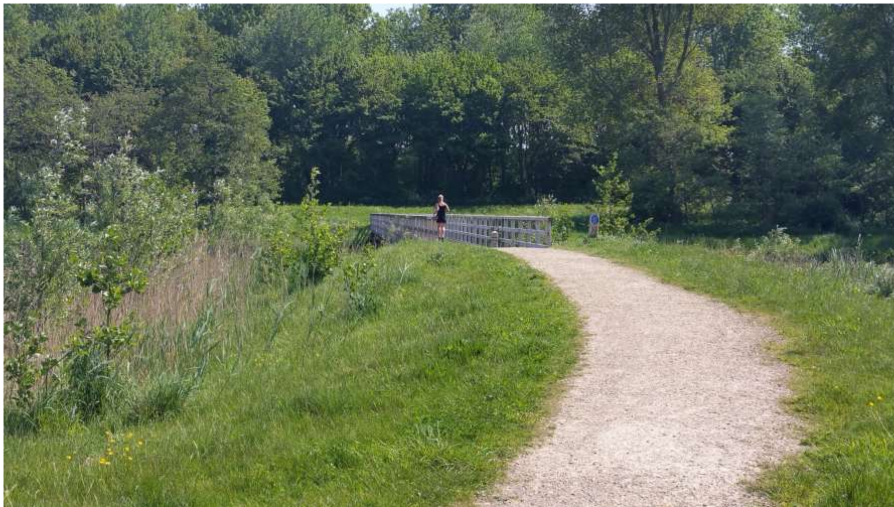
Figuur 5 Hardlooper op de brug tussen Diepsmeer en Zomerdel