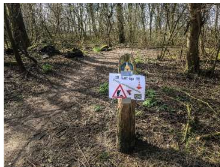
Figuur 6 Onderhoudswerkzaamheden aan het MTB-parcours GAB