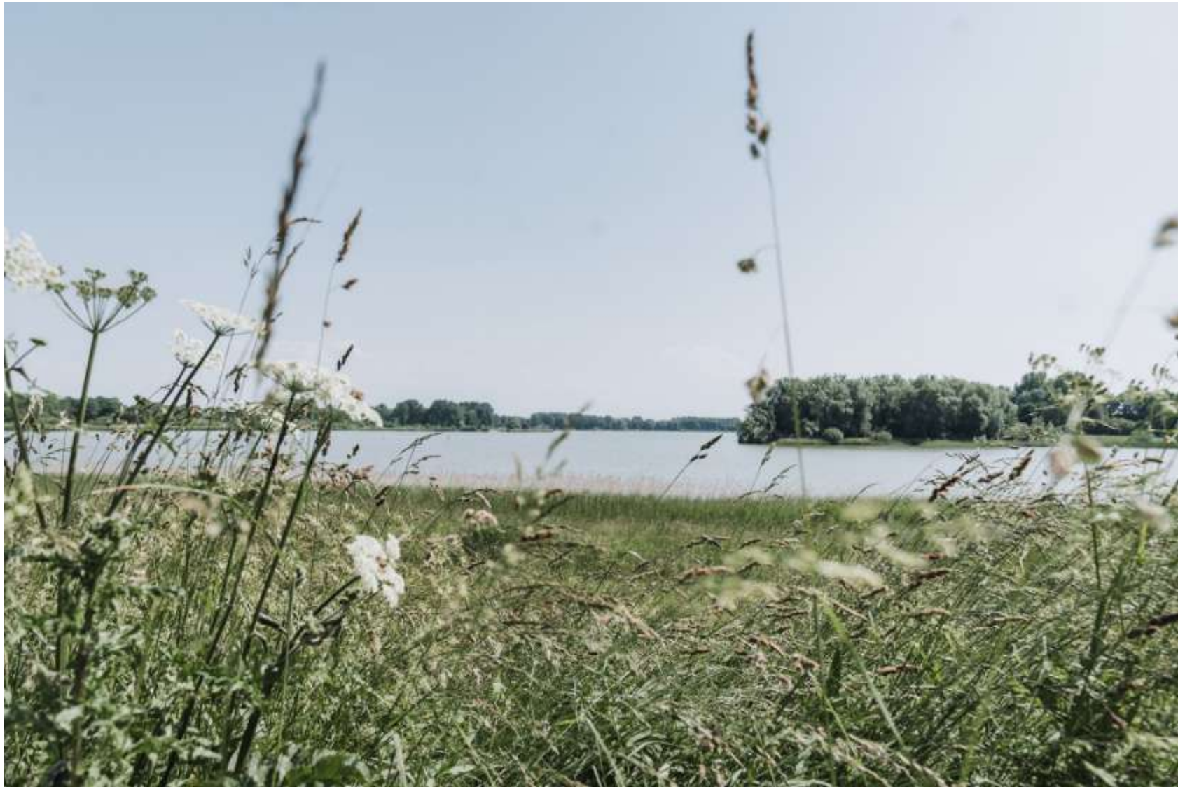
Figuur 10 Rustiek uitzicht over de Zomerdel