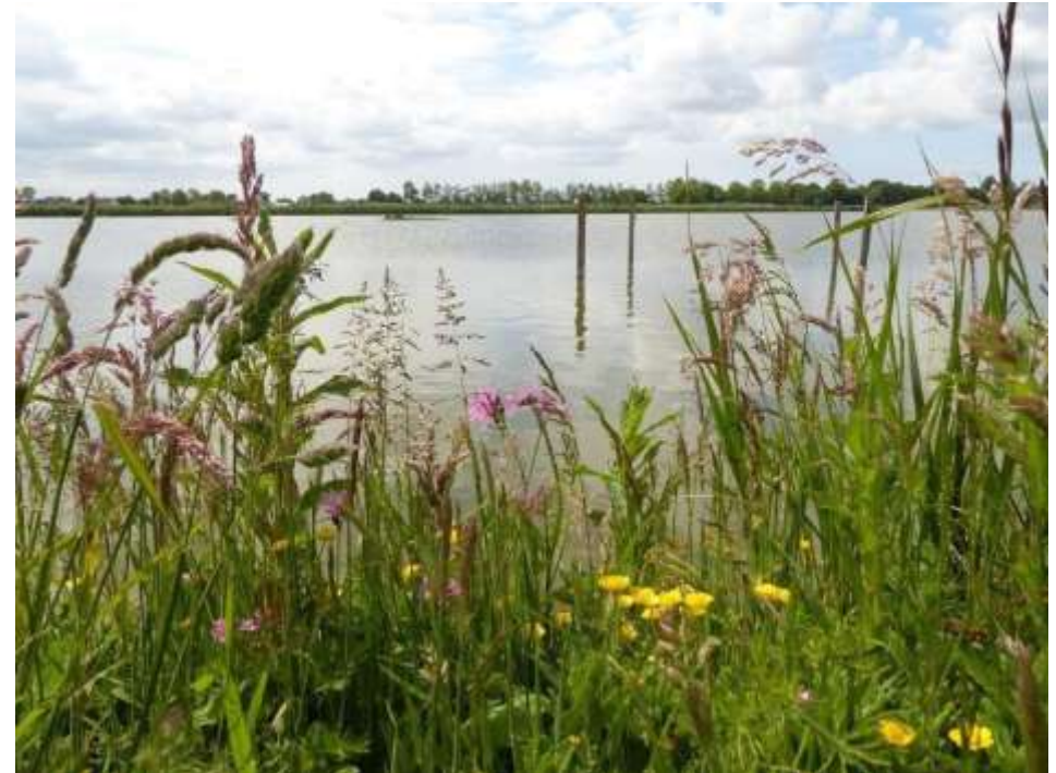
Figuur 11 Bloemenpracht langs het water van de Zomerdel