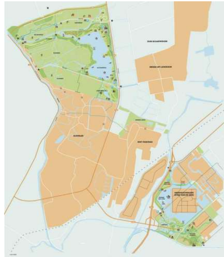
Figuur 2 Kaart met de redactiegebieden Geestmerambacht, Groene Loper en Park van Luna