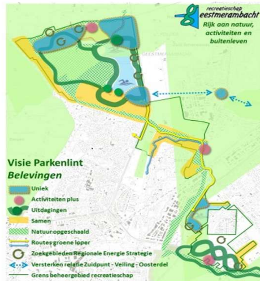
Figuur 4 Schets van de visie Parkenlint