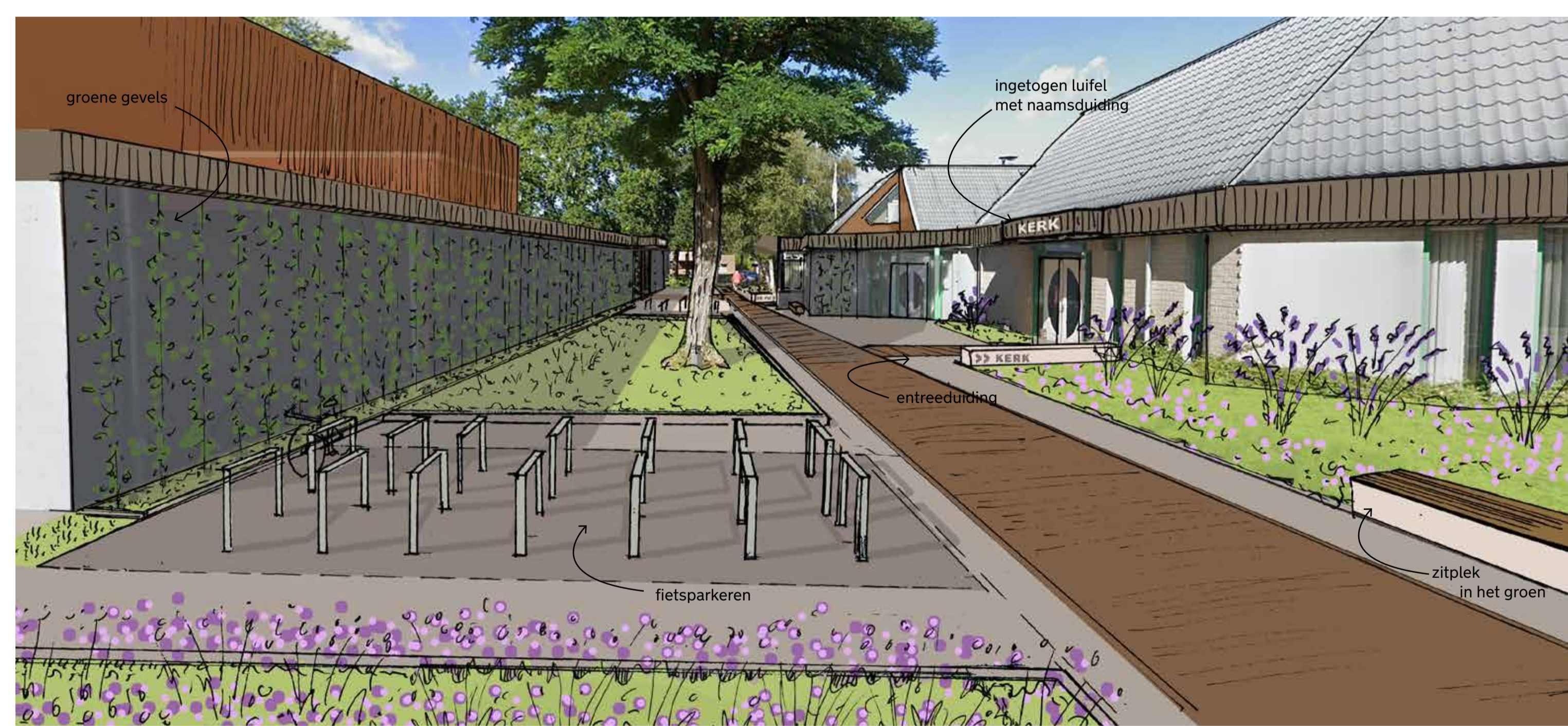
Impressie loper vanaf parkeerveld