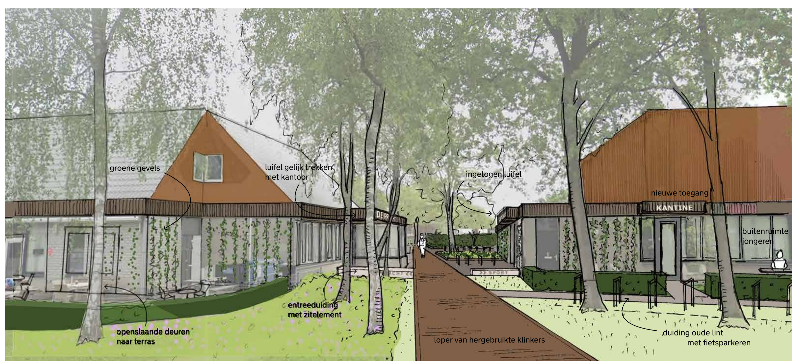
Impressie loper vanaf Frederik Hendrikstraat