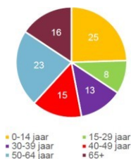
Leeftijd binnenlandse toeristen in Limburg (2015)

De vraag in de vrijetijdsmarkt in Valkenburg aan de Geul kan uitgesplitst worden in dagrecreatie en (binnenlandse) vakanties 3 .