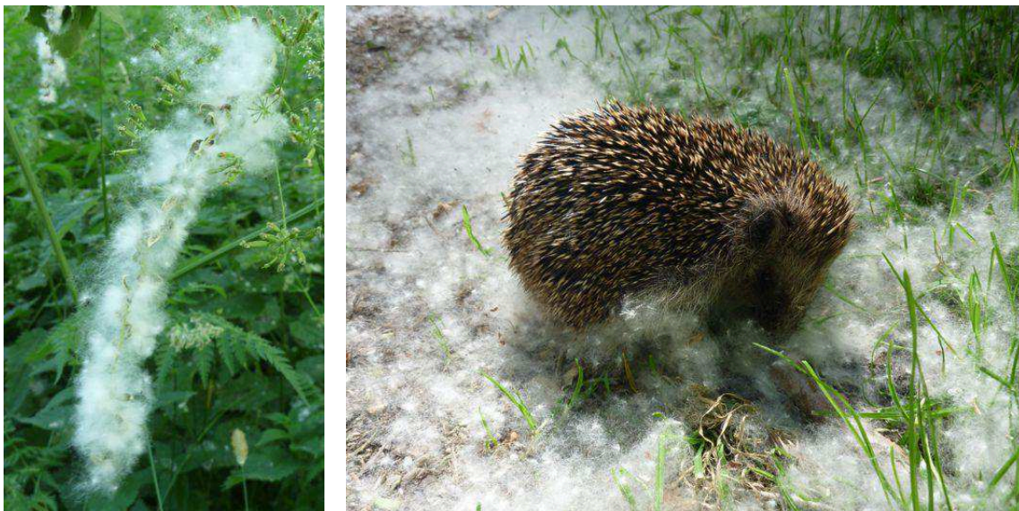
Bloeiwijze van Canadapopulier met pluis en een sneeuwtapijt door de pluis

Er is wel elke zomer een sneeuwtapijt van pluis van de Canadapopulier te zien; ook ver van de bomen. Dit is veelal loos pluis zonder zaad waardoor het heel lang in de lucht blijft hangen; dit is wel waarneembaar als een soort sneeuw. Het geeft deze boom de bijnaam Kapokboom.